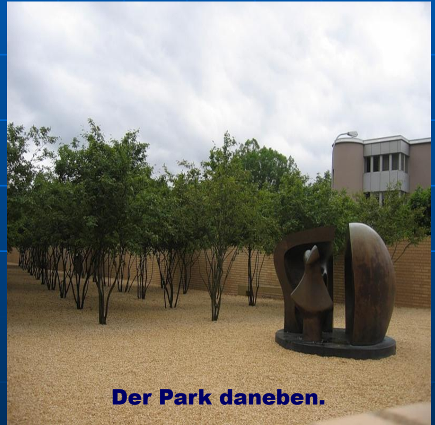
Der Park daneben.