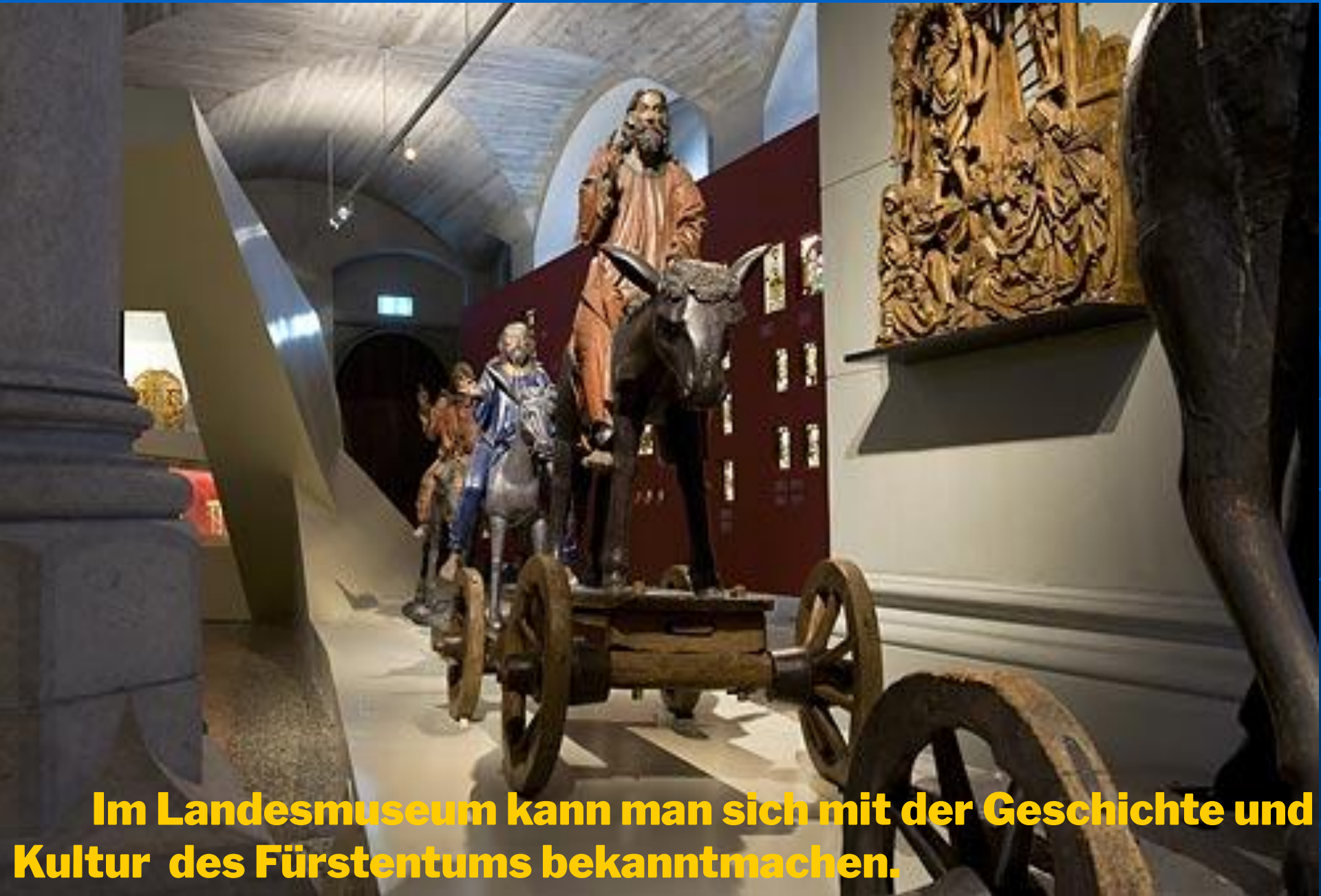
Im Landesmuseum kann man sich mit der Geschichte und Kultur des Fürstentums bekanntmachen.