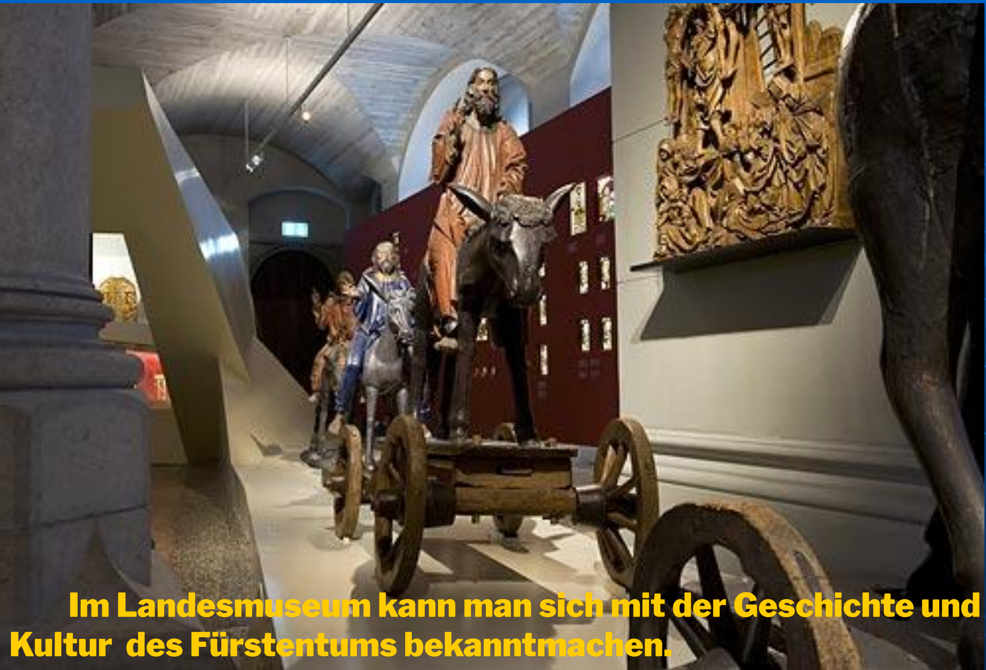
Im Landesmuseum kann man sich mit der Geschichte und Kultur des Fürstentums bekanntmachen.