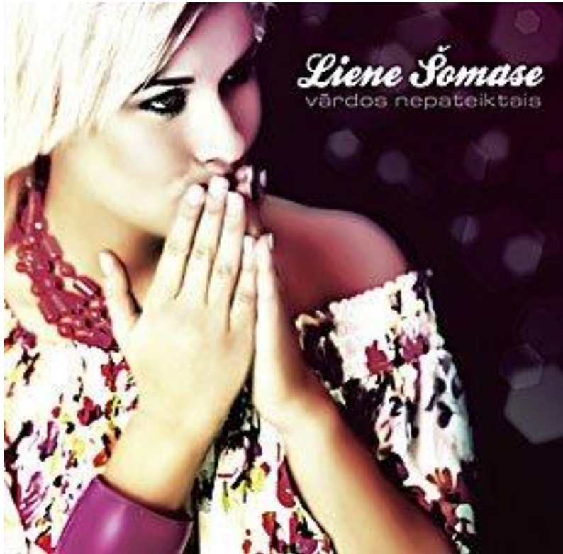
Vārdos nepateiktais (2008)