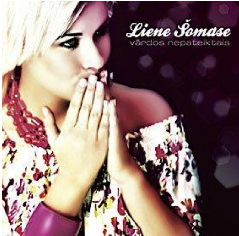
Vārdos nepateiktais (2008)