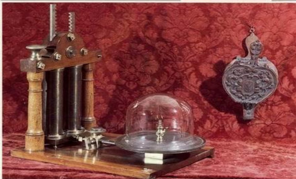
Воздушный насос XVIII в. Музей М.В.Ломоносова, Ленинград

Ломоносов считал химию своей «главной профессией», причем развитие химии, по мнению ученого, должно было помочь решению практических задач. «Истинный химик должен быть теоретиком и практиком», — писал он. Став профессором химии, Ломоносов начал добиваться создания химической лаборатории.