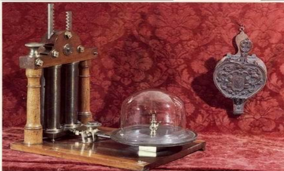
Вспомогательный аппарат XVIII в. Музей М.В.Ломоносова, Ленинград

Ломоносов считал химию своей «главной профессией», причем развитие химии, по мнению ученого, должно было помочь решению практических задач. «Истинный химик должен быть теоретиком и практиком», — писал он. Став профессором химии, Ломоносов начал добиваться создания химической лаборатории.