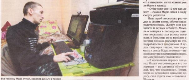
Все технику Марк купил, накопив деньги с пенсии

вред психикой Вячеслав Штегеля. – Многие мамы выданные платят искать родных, но мало у кого это получается. Даже если мать и отец действительно живы, на контакт зачастую опьяняют.