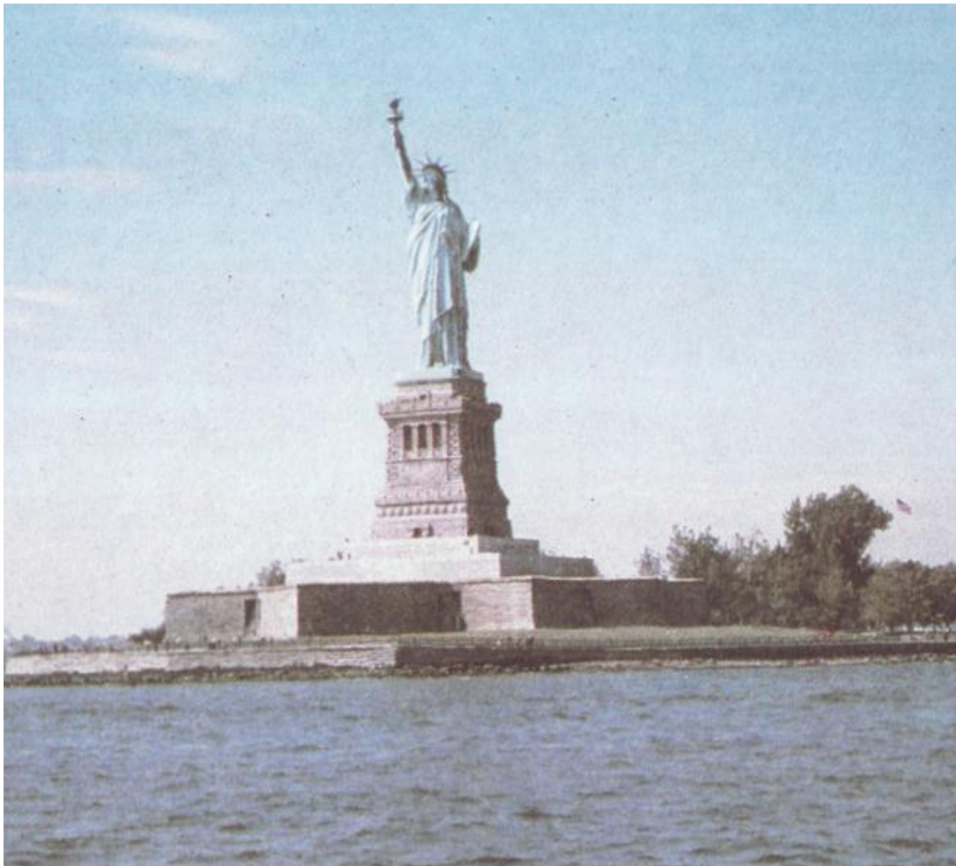
The Statue of Liberty