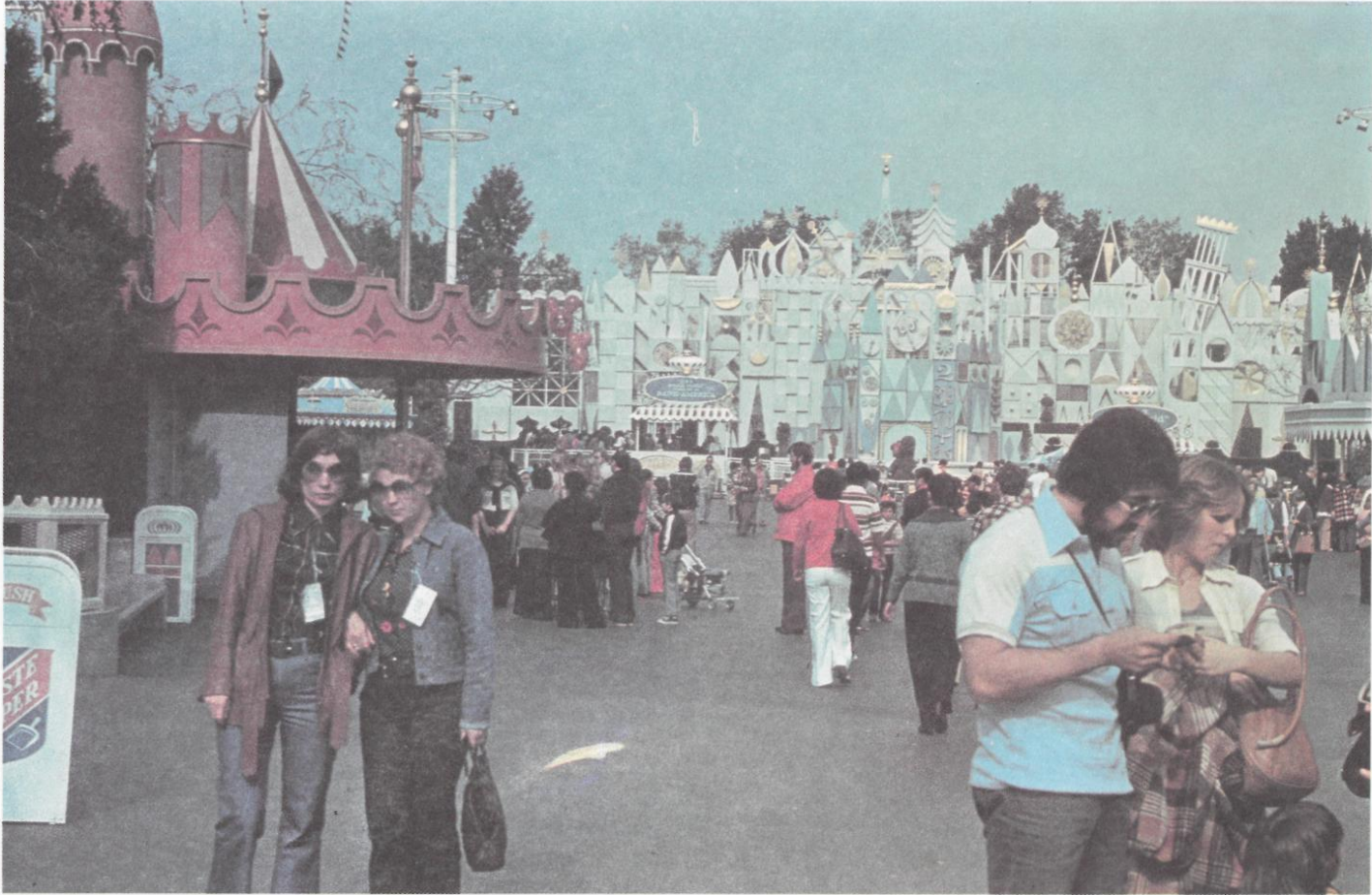
86. Los Angeles. Disneyland. Fairy Castle