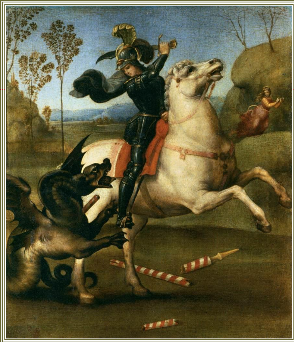
Рафаель. Св.Георгій, що бореться з драконом