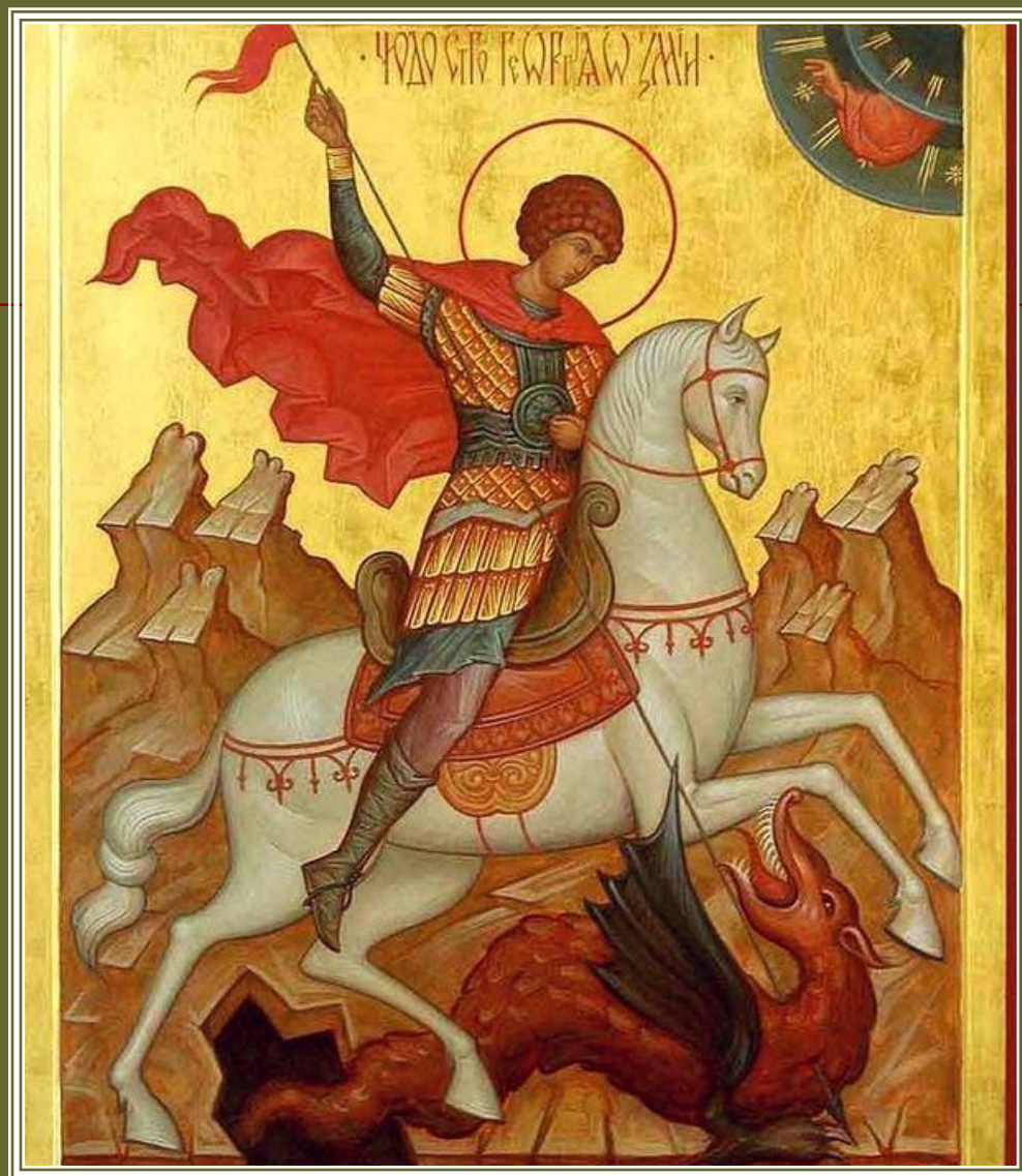
І.Нестеренко Георгій Побідоносець