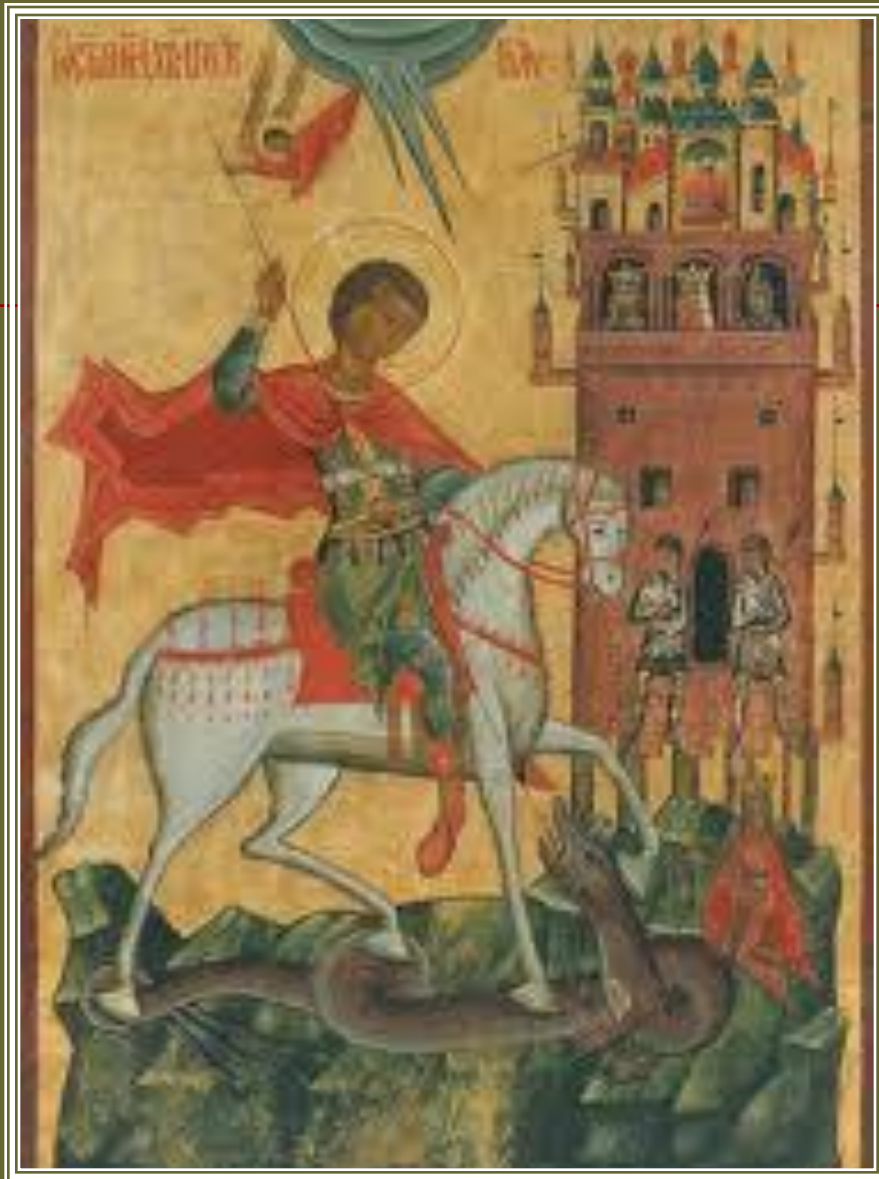
Юрій – зміборець. Давньоруська ікона XV ст.