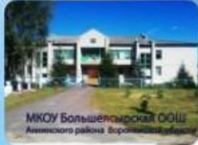
МКОУ Большеясырская ООШ Аннинского района Воронежской области