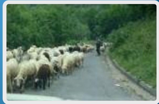
sheep - sheep