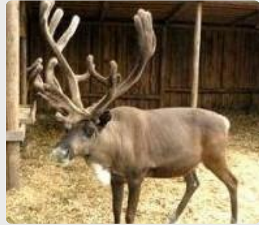
deer - deer