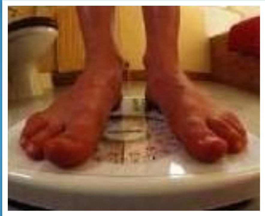
foot - feet