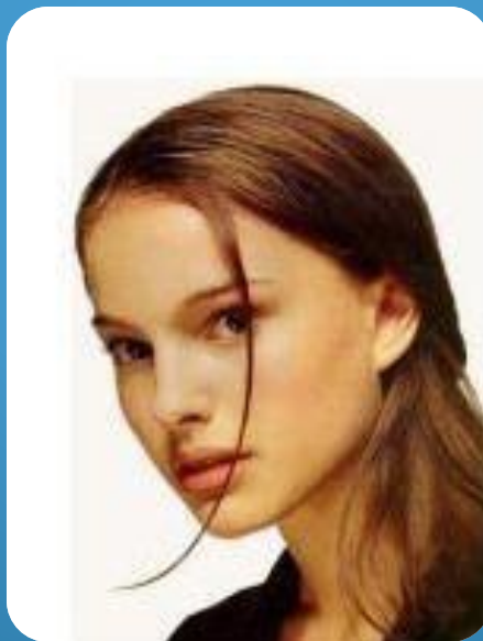
woman - women