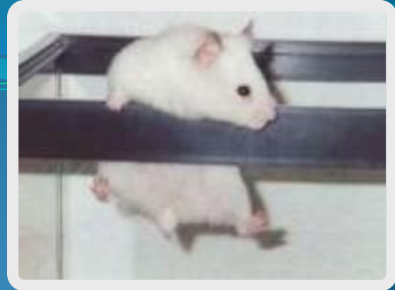
mouse - mice