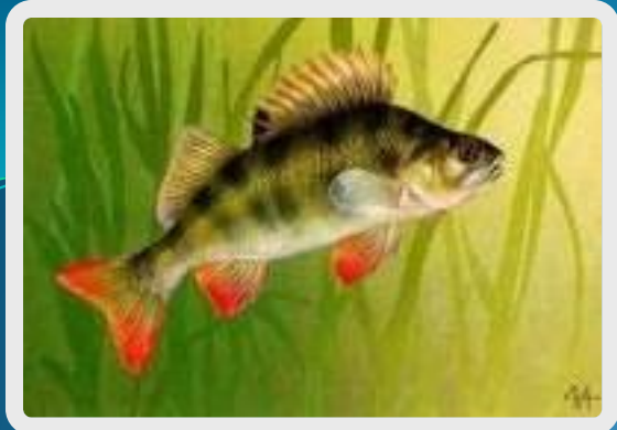
fish - fish