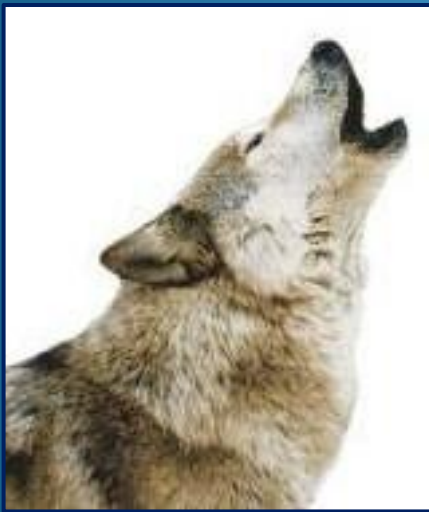
wolf - wolves