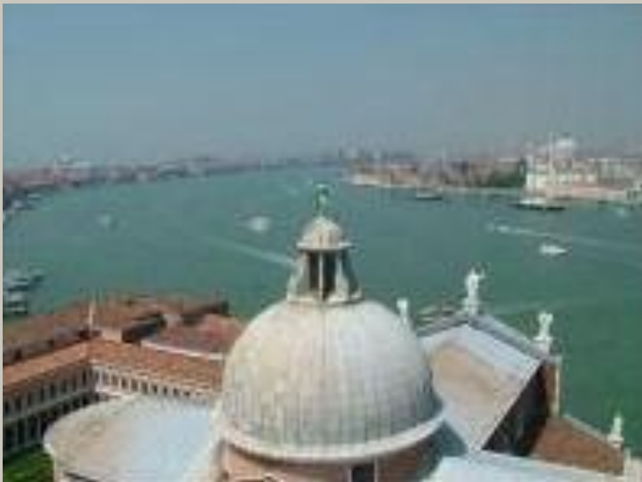
roof - roofs