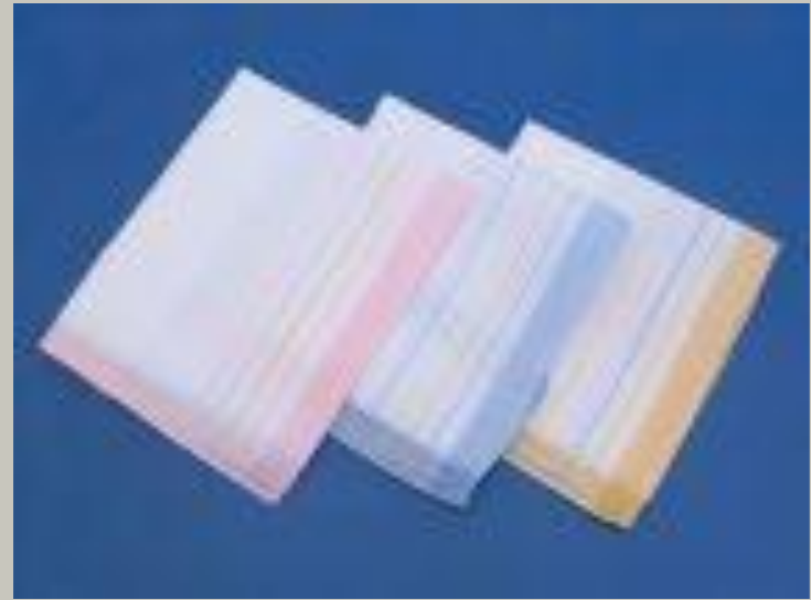
handkerchief - handkerchiefs