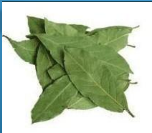
leaf - leaves