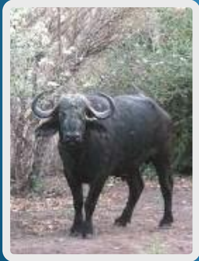
ox - oxen