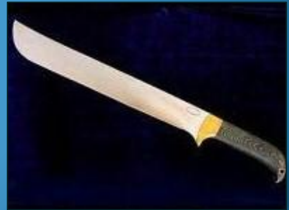
knife - knives