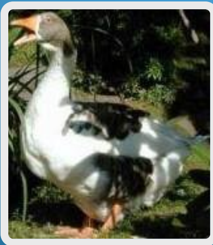
goose - geese