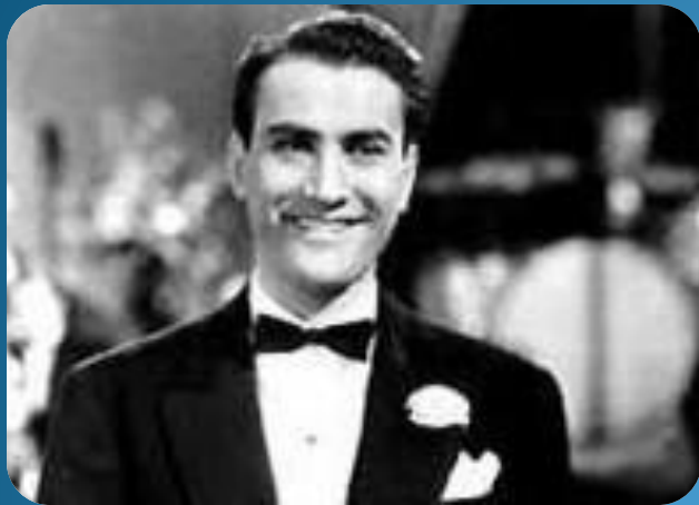
man - men