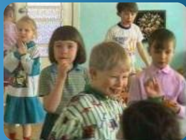
child - children