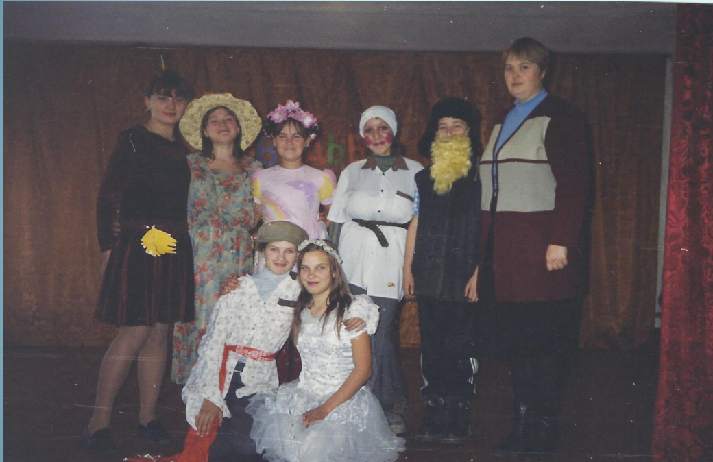
Сценка «КАК ФЕДОТ КАПУСТУ ЖЕНИЛ»