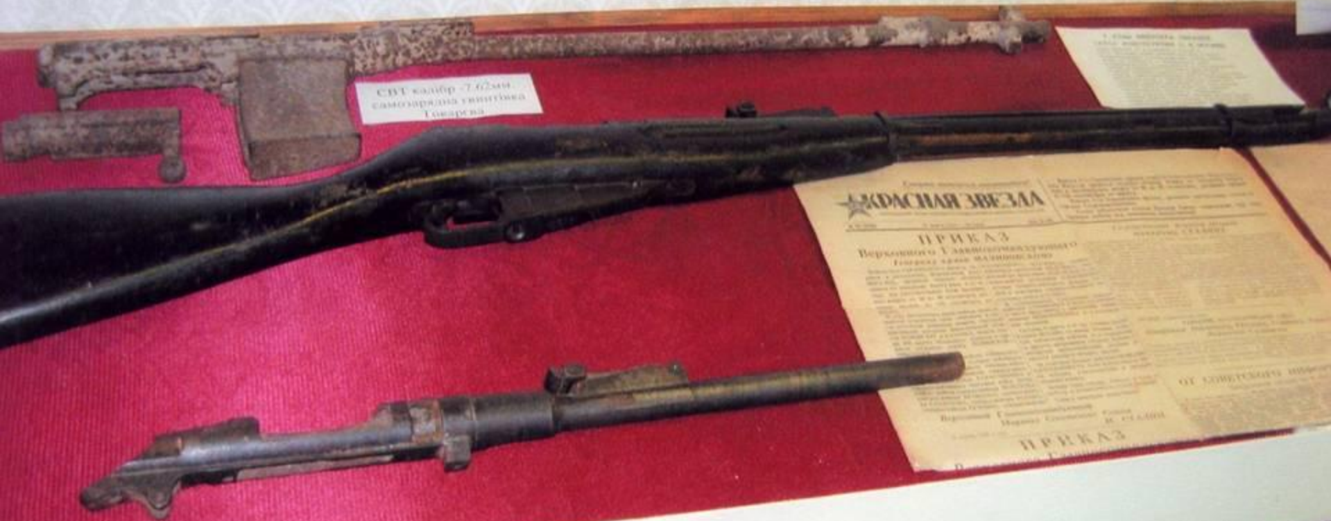
СВТ калибр - 7,62мм. самозарядна винтовка Говарда

УСТАВНИК ВЕРХОВНОГО ГЛАВНОКОМАНДУЮЩЕГО ОУЧАЩЕГО СЕЛСКОГО НАСТАВНИКА