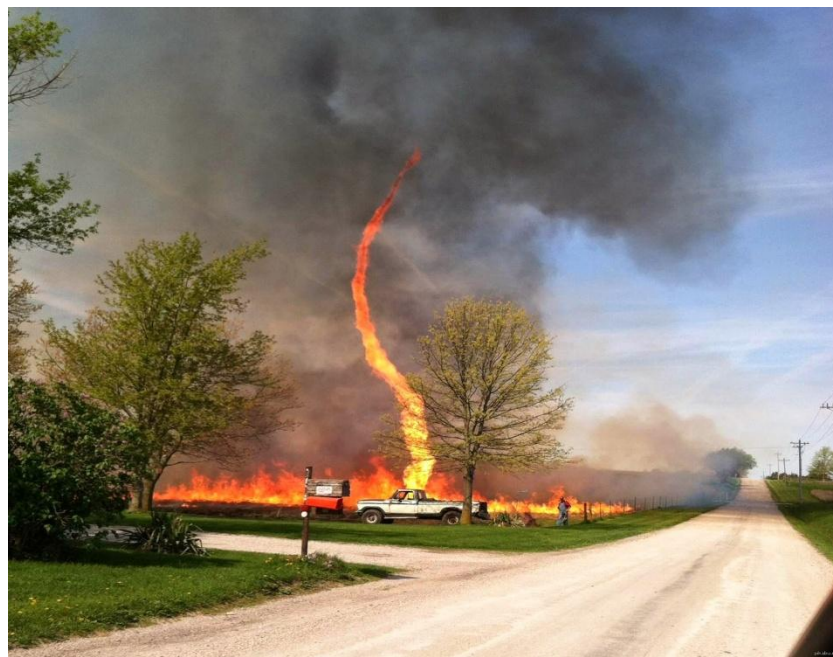
Огненный смерч в Миссури