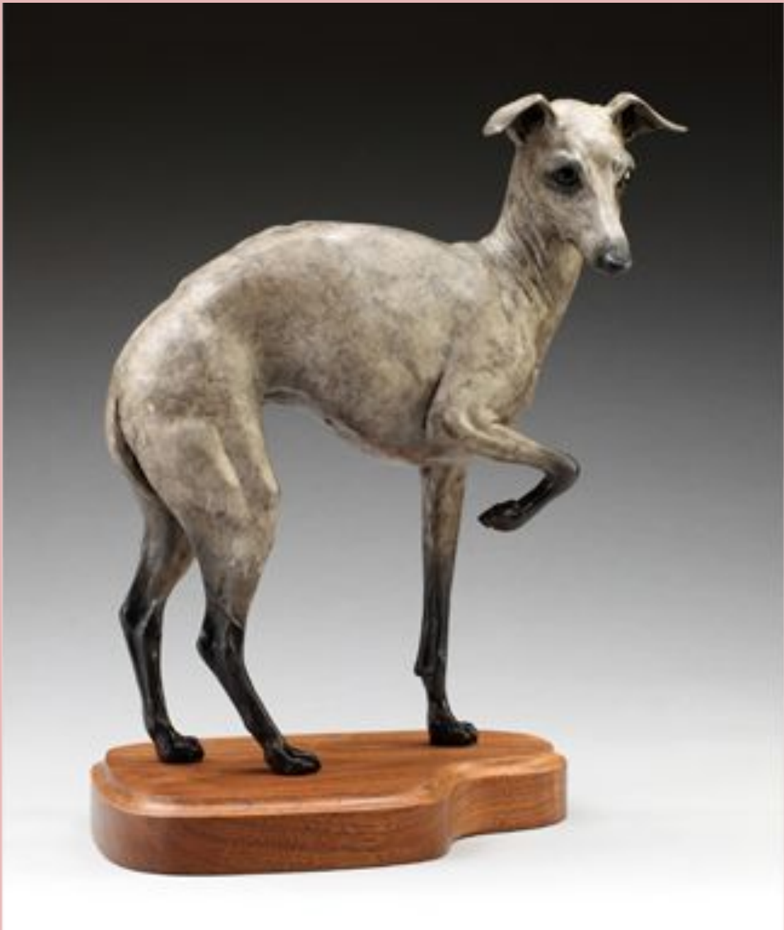
Little Diva Tammy Bailly, Twentieth Century bronze, Gift of The Art Show at The Dog Show