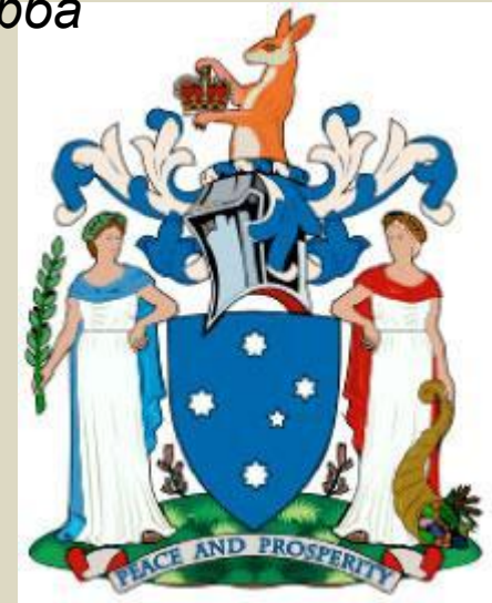
Полное изображение герба

Созвездие Южного Креста (одна звезда восьмиконечная, две семиконечных, одна шестиконечная и одна пятиконечная). Вверху — кенгуру с имперской короной. Девиз: «Мир и процветание».