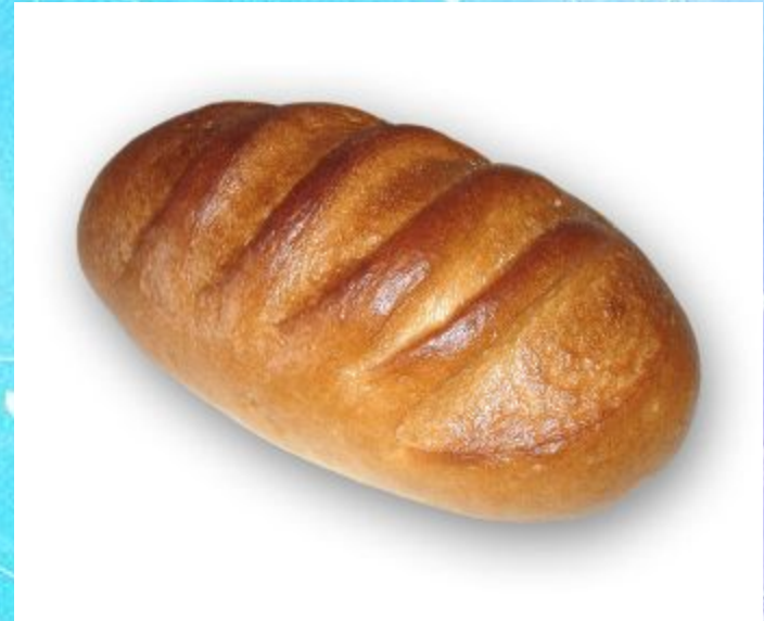
A long loaf of bread