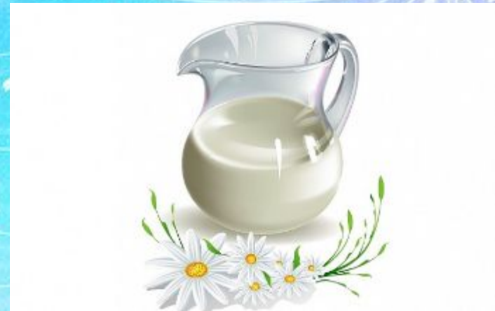
A jug of milk