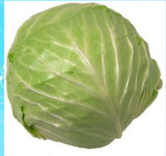
a head of cabbage