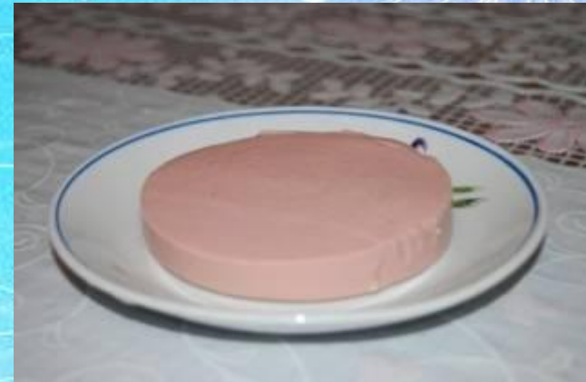
A slice of sausage