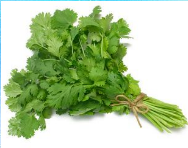
A small bunch of parsley