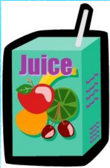
A packet of juice