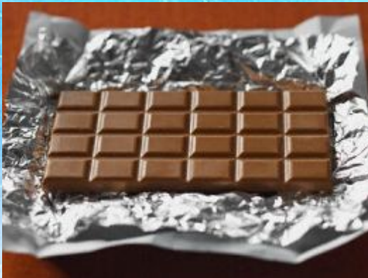
A bar of chocolate