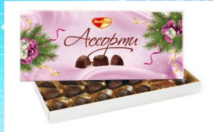
A box of sweets