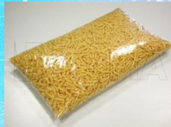
A packet of macaroni