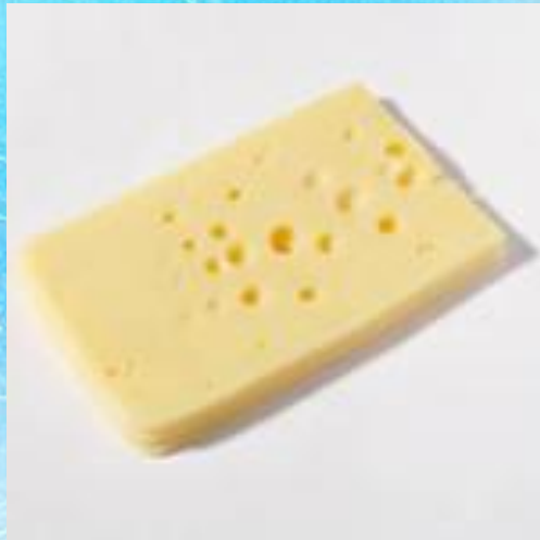
A piece of cheese