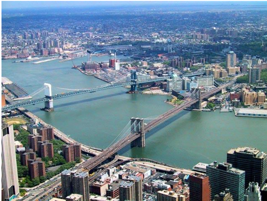
Бруклінський міст (Brooklyn Bridge)