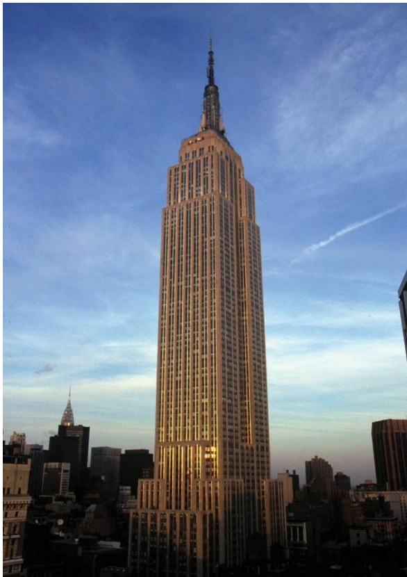
Емпайр-стейт (Empire State Building)