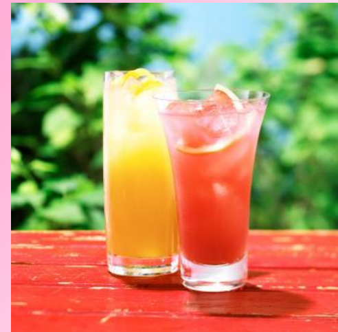
Two glasses of juice