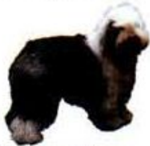
It is a dog.

? с исчисляемыми существительными в единственном числе, когда хотим сказать, кем или чем является данный объект, либо хотим указать чью-то профессию.