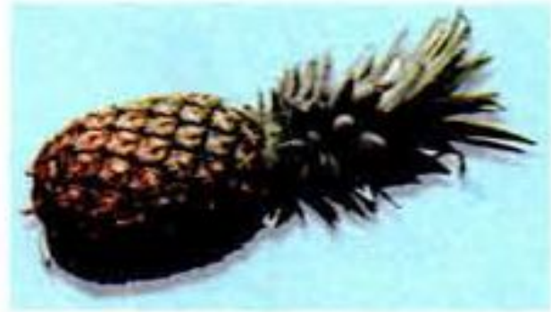
8 ..... pineapple