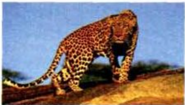
1 ... a ... leopard