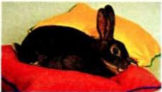
3 ..... rabbit