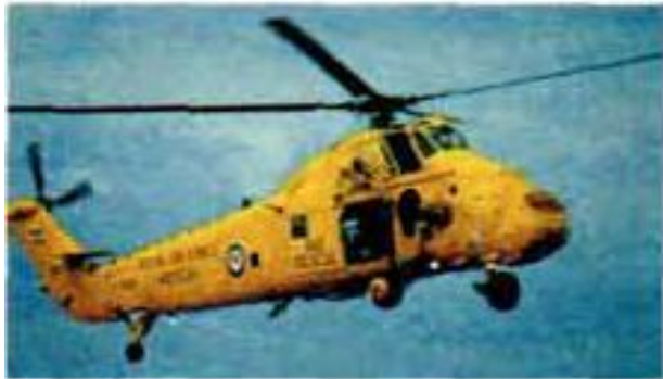
5 ..... helicopter