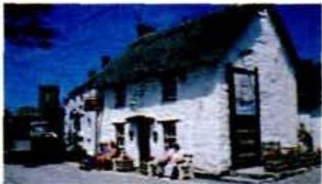
4 ..... old house