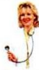
She is a doctor.