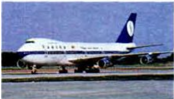
7 ..... aeroplane