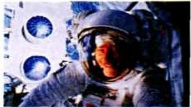
2 ..... astronaut