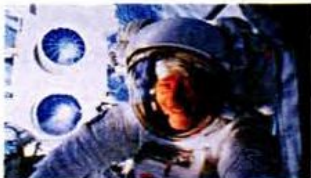
2 ..... astronaut