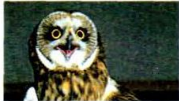
6 ..... owl