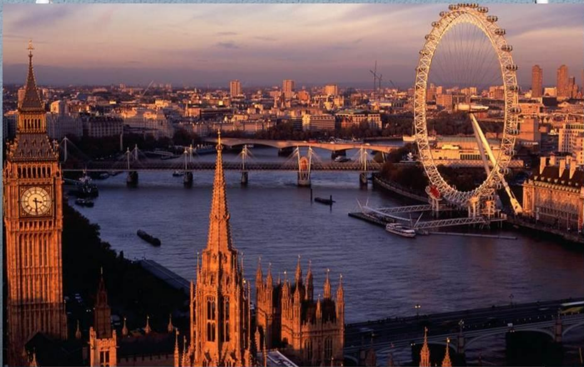
Столица Британии – Лондон.