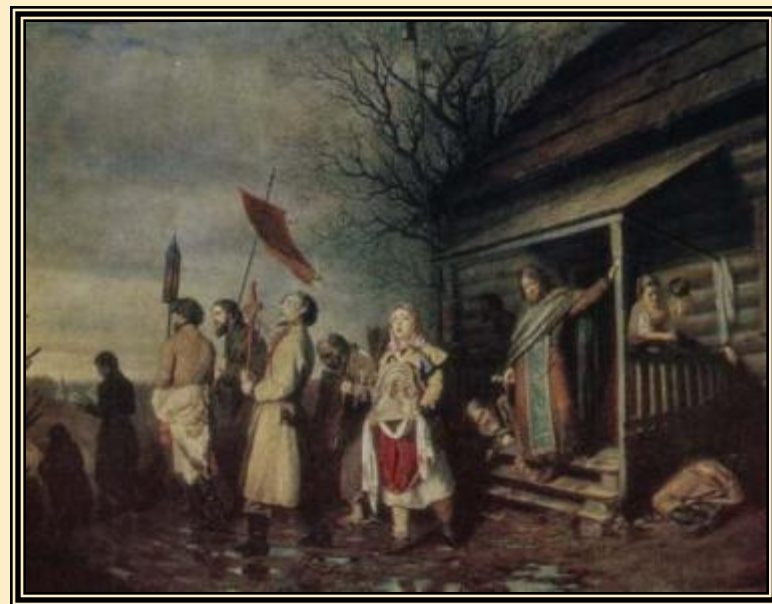
« Сельский крестный ход на Пасху» 1861г.