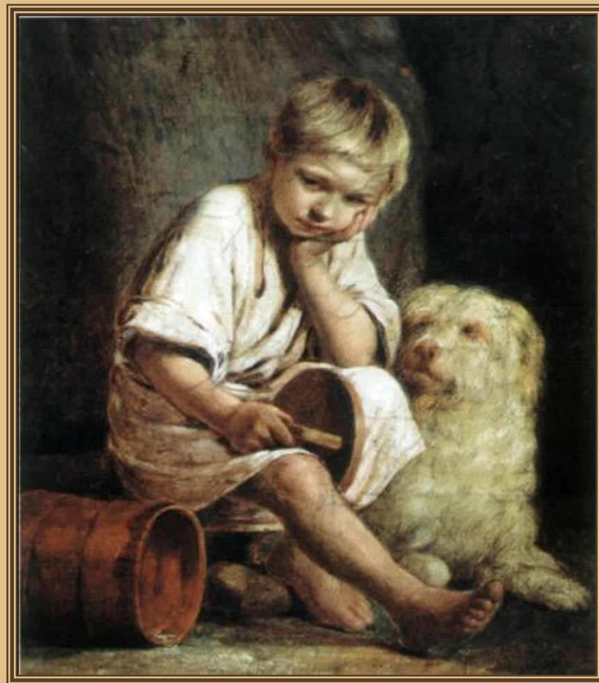
«Вот - те и батькин обед»