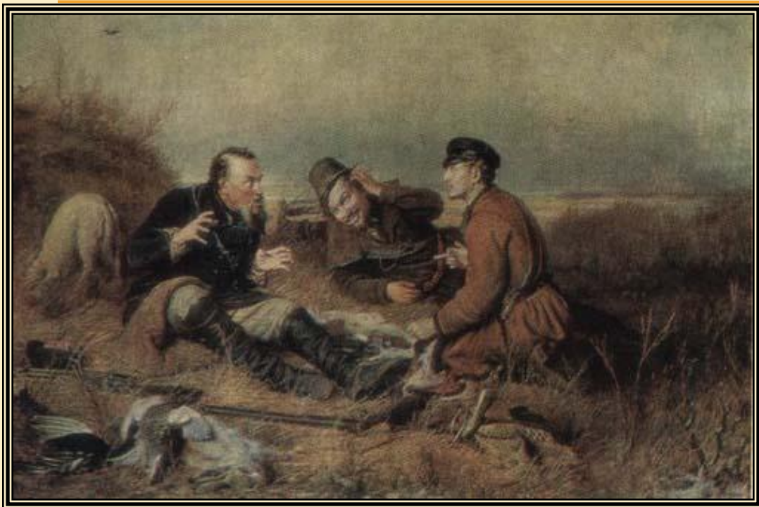
« Охотники на привале» 1870г.