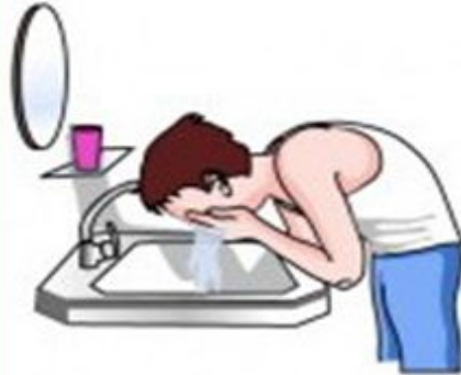
wash your face