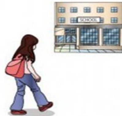
go to school