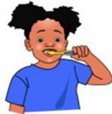
brush your teeth