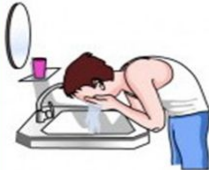
wash your face