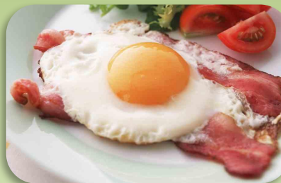
(Bacon and eggs)

b) Традиционное сладкое блюдо с фруктами, похожее на желе, крем.