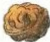
nut [nʌt] орех