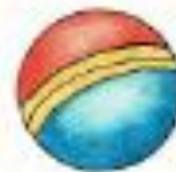
ball [bɔ:l] мяч