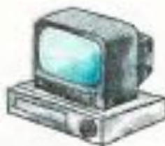
video [ˈvɪdɪəʊ] видеомагнитофон