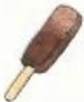
ice cream [ˈaɪskri:m] мороженое