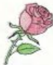
rose [rəʊz] роза