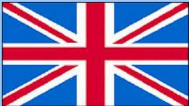
Соединённое Королевство Великобритании и Северной Ирландии