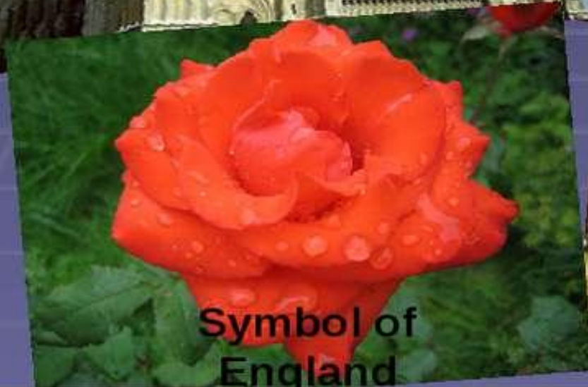
Symbol of England