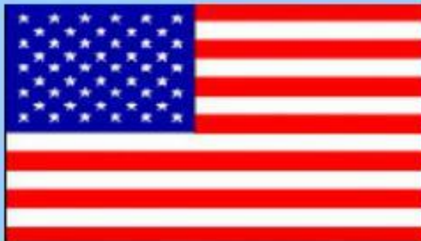
Соединённые Штаты Америки