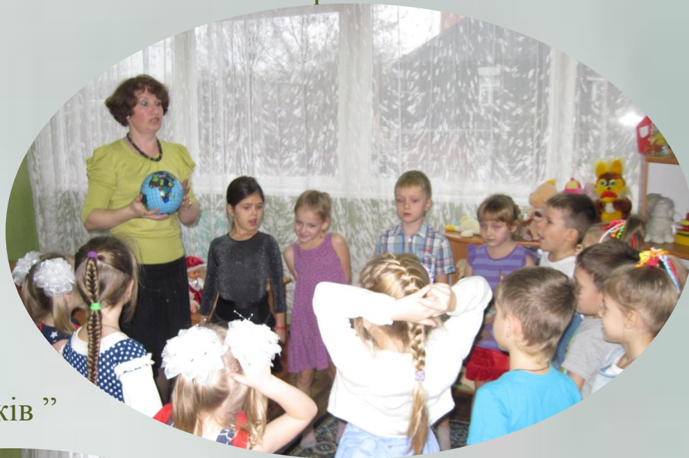
Гра «Сім'я пальчиків»