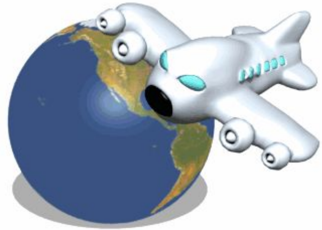
Tom's plane Tom