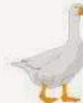
SINGULAR A GOOSE