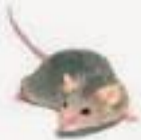
SINGULAR A MOUSE