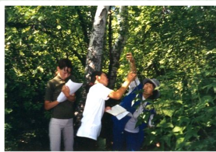
Черёмуховая падь The Bird Cherry Tree Forest