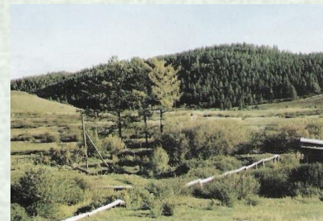
Аршан Ухаа Толгой The Source Ukhaa-Tolgoi