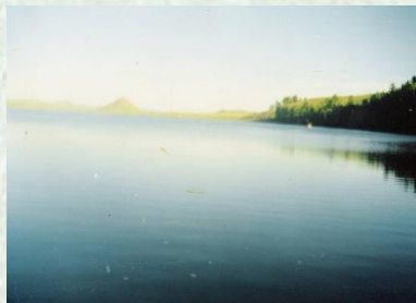
Карасиное озеро Crucian Lake