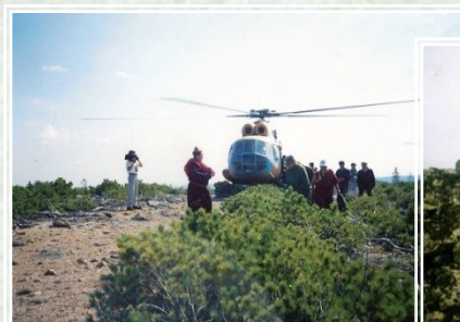
Обоо Чингисхана The Top of Chingiskhan