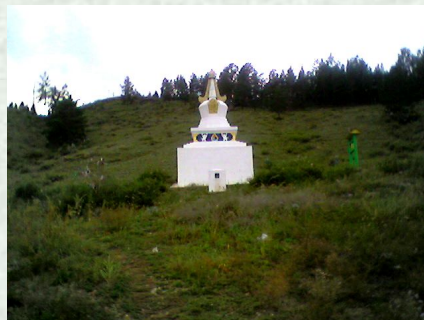
Шэнэһэтэ The Grove Shenehete