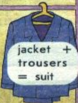
jacket + trousers = suit