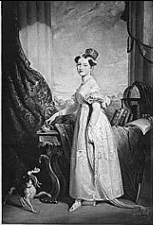
H. R. H. Princess Victoria 1833

From the picture after Sir G. Kneller at Windsor Castle