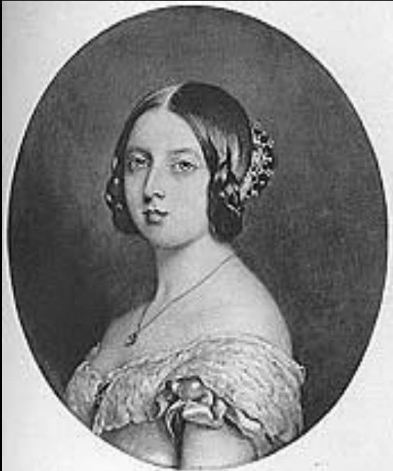
H.M. Queen Victoria 1842 By Easton after Winterhalter From the miniature at Buckingham Palace

Имя королевы Виктории в Британской истории связано с ростом промышленности и экономической стабильности. Во внешней политике влияние королевы долгое время использовалось для поддержания мира и согласия. Так, её письмо немецкому Императору в 1875 году помогло избежать второй франко-немецкой войны. Во время её правления были проведены крупнейшие реформы, повлиявшие на дальнейшее развитие страны. Она поддерживала многие благотворительные учреждения, вовлеченные в образование, больницы. После её смерти было сказано: «Великобритания имела международную империю, над которой никогда не заходило солнце»