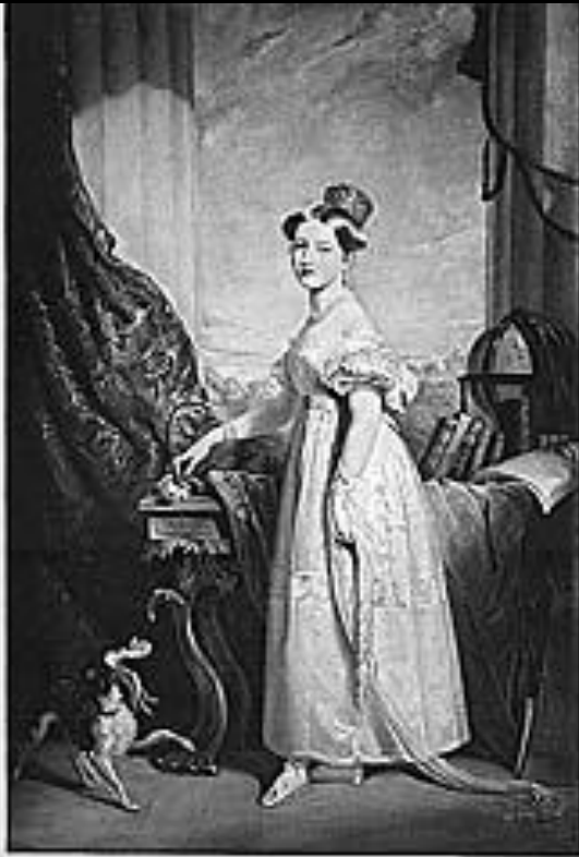
H. R. H. Princess Victoria 1833

From the picture after Sir S. Hayter at Windsor Castle