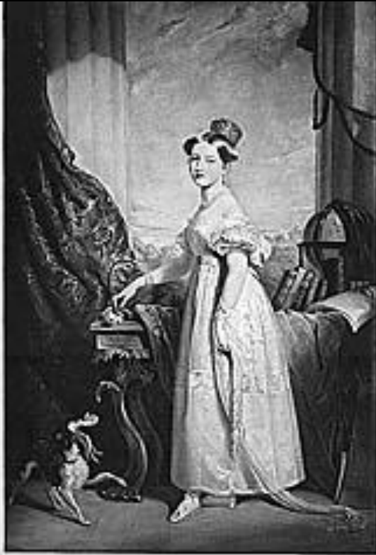
H. R. H. Princess Victoria 1833

From the picture after Sir S. Hayter at Windsor Castle