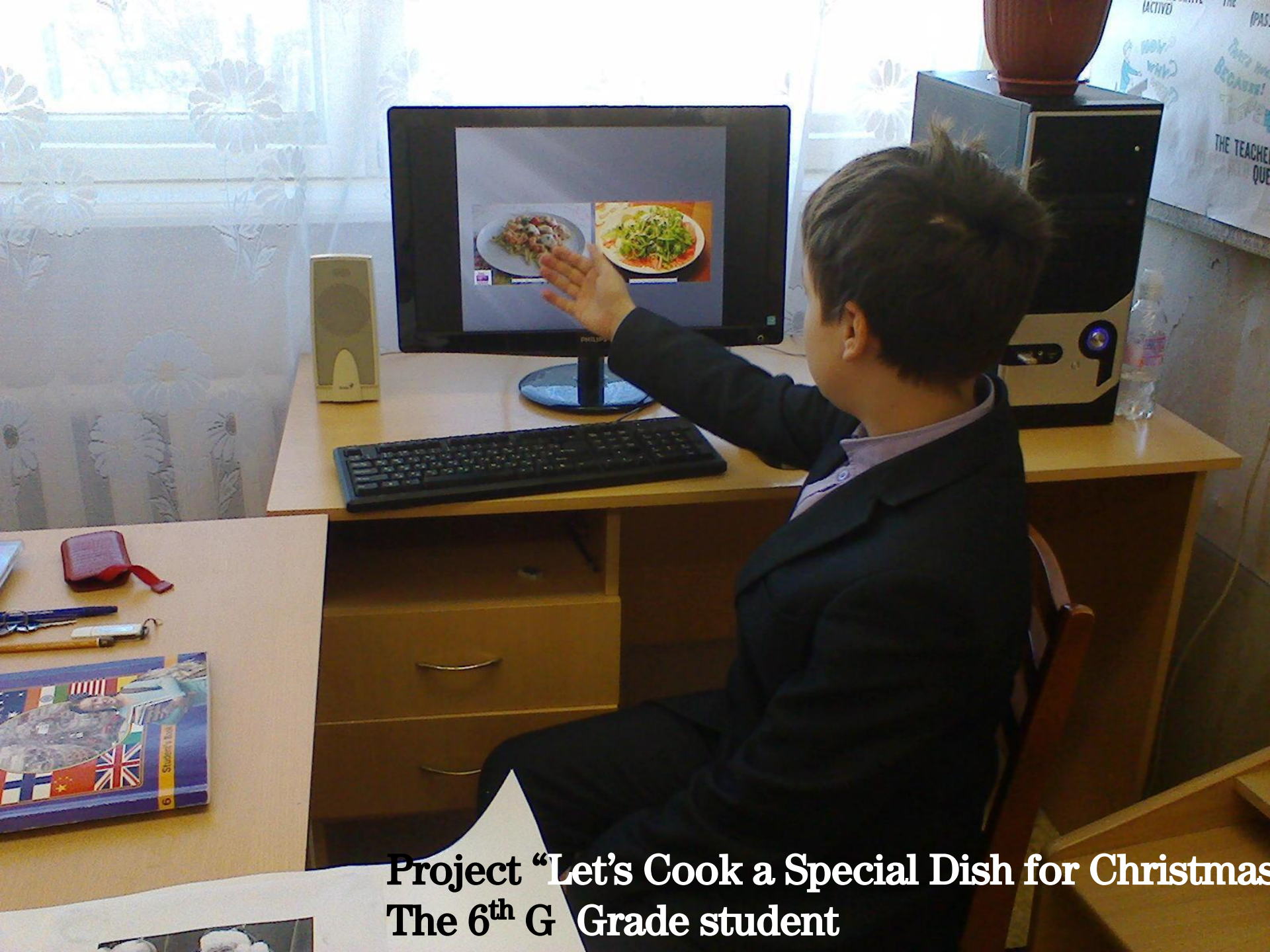
Project “Let’s Cook a Special Dish for Christmas” The 6 th G Grade student