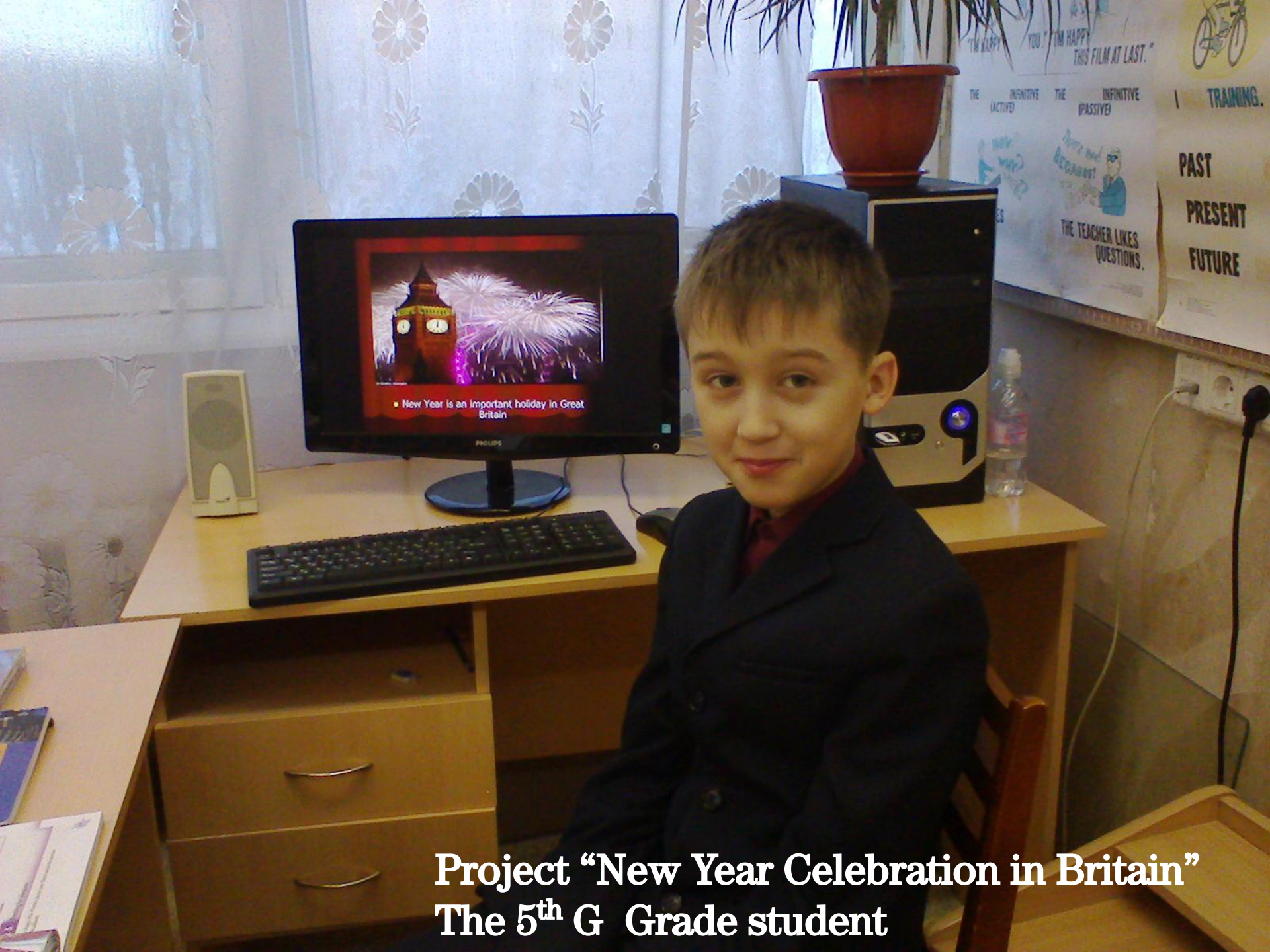
Project "New Year Celebration in Britain" The 5 th G Grade student