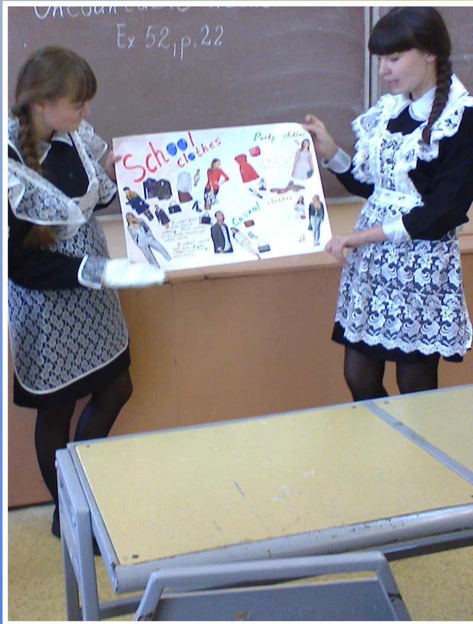
Project «Fashion Show» The 10 th B Grade students