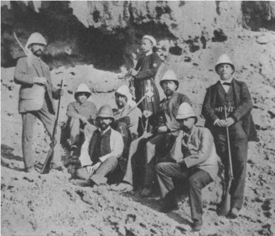
Die deutsche Cholera-Expedition in Ägypten; Koch ist der Dritte von rechts