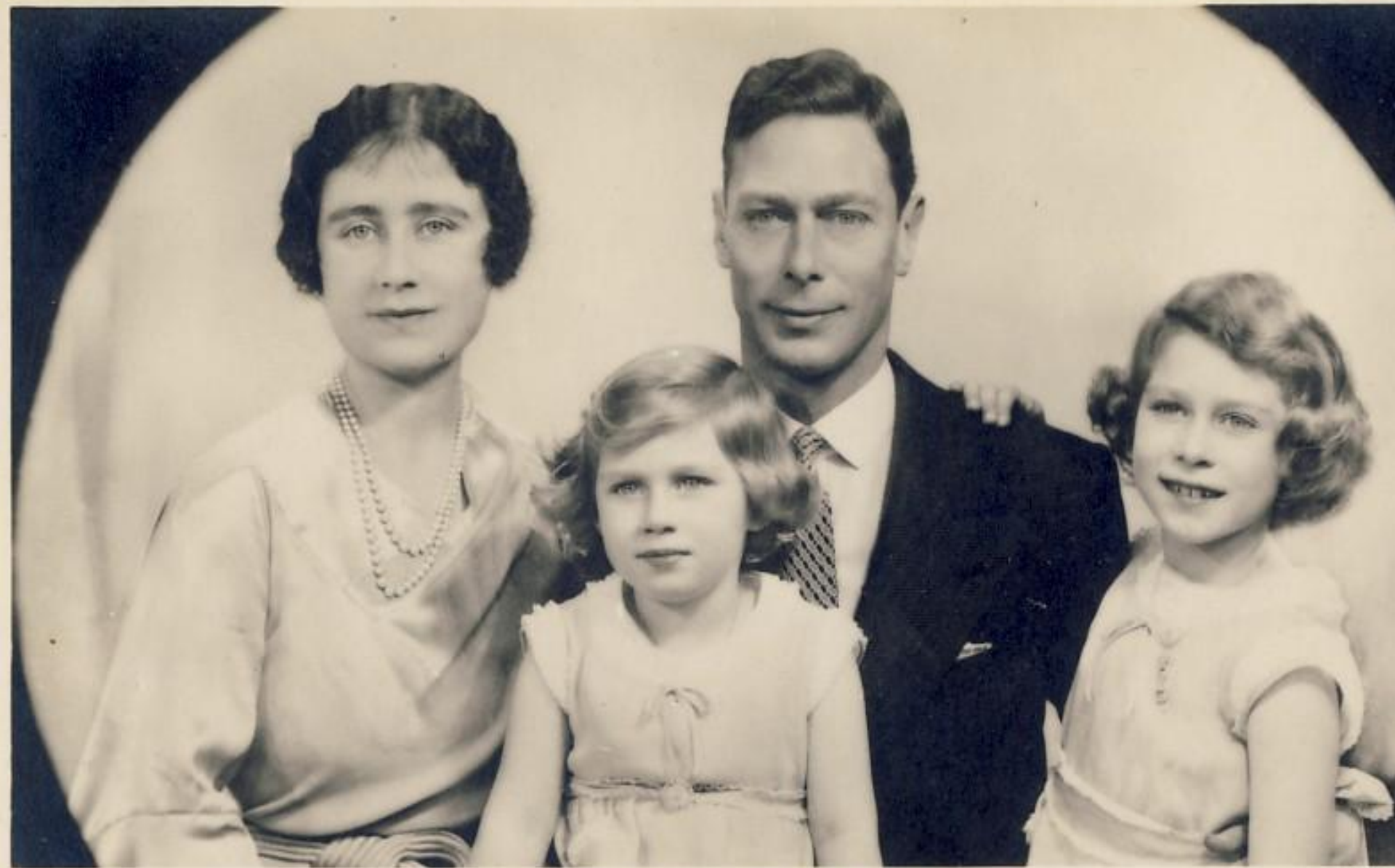
THEIR MAJESTIES THE KING & QUEEN AND T.R.H. THE PRINCESSES ELIZABETH & MARGARET ROSE