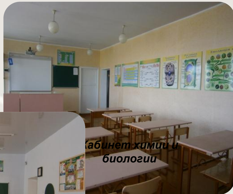
Кабинет химии и биологии