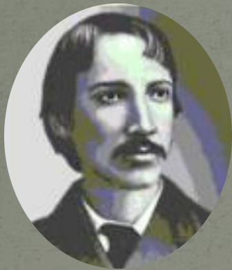
Мировую известность приобрел представитель позднего романтизма, создатель авантюрных и исторических романов Роберт Льюис Стивенсон .