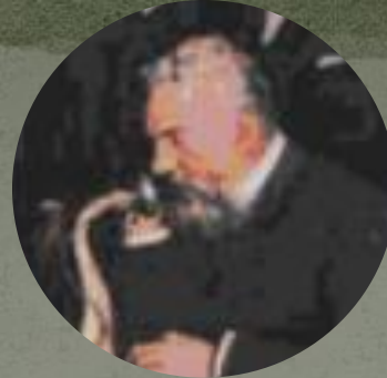
Александр Грем Белл

Прославился как один из самых успешных предпринимателей Америки, прошедший путь от простого бедняка-иммигранта до промышленного магната и филантропа.