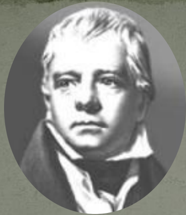
Сэр Вальтер Скотт - английский писатель.