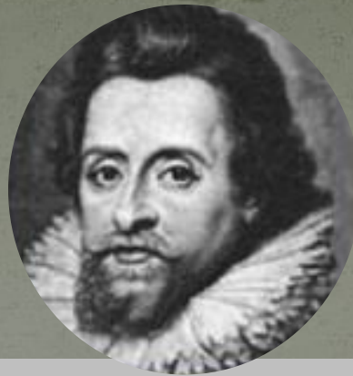
Яков I Стюарт Английский король с 1603 года, шотландский король (под именем Якова VI) с 1567 года. Из династии Стюартов, сын Марии Стюарт.

В средние века народ независимой Шотландии вел упорную борьбу за суверенитет, но в 1707 г. династия Стюартов присоединила Шотландию к Великобритании через личную унию, упразднив существовавший с XIII в. парламент.