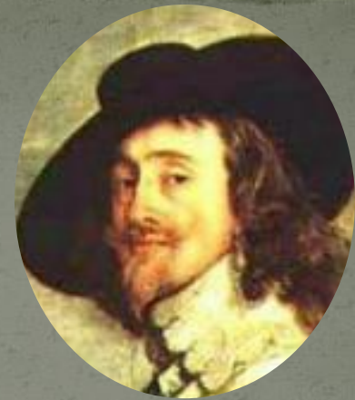
Карл I Стюарт Английский король с 1625 г. Второй сын шотландского короля Якова VI Стюарта и Анны Датской.

In the middle ages people independent Scotland led a stubborn struggle for sovereignty, but in 1707 the dynasty of the Stuarts of prisoedinil Scotland to the U.K. through the personal Union, abolishing existing with XIII century Parliament.