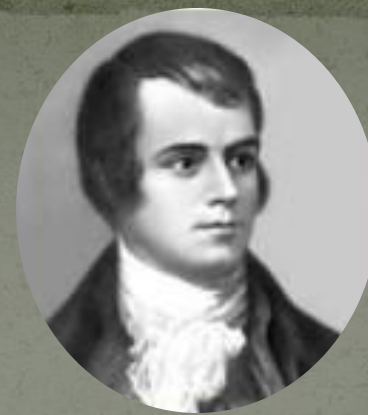
Бернс Роберт - шотландский поэт.