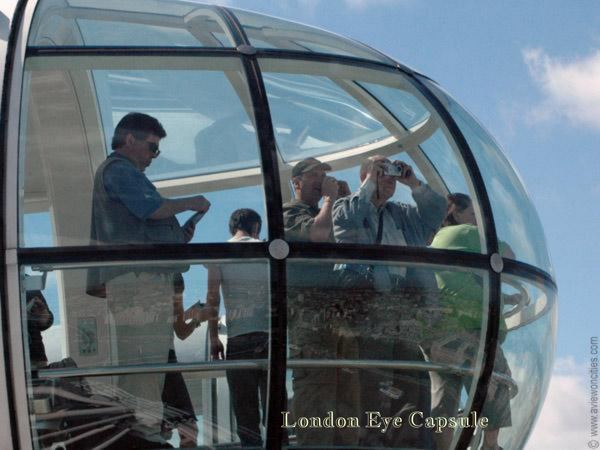
London Eye Capsule