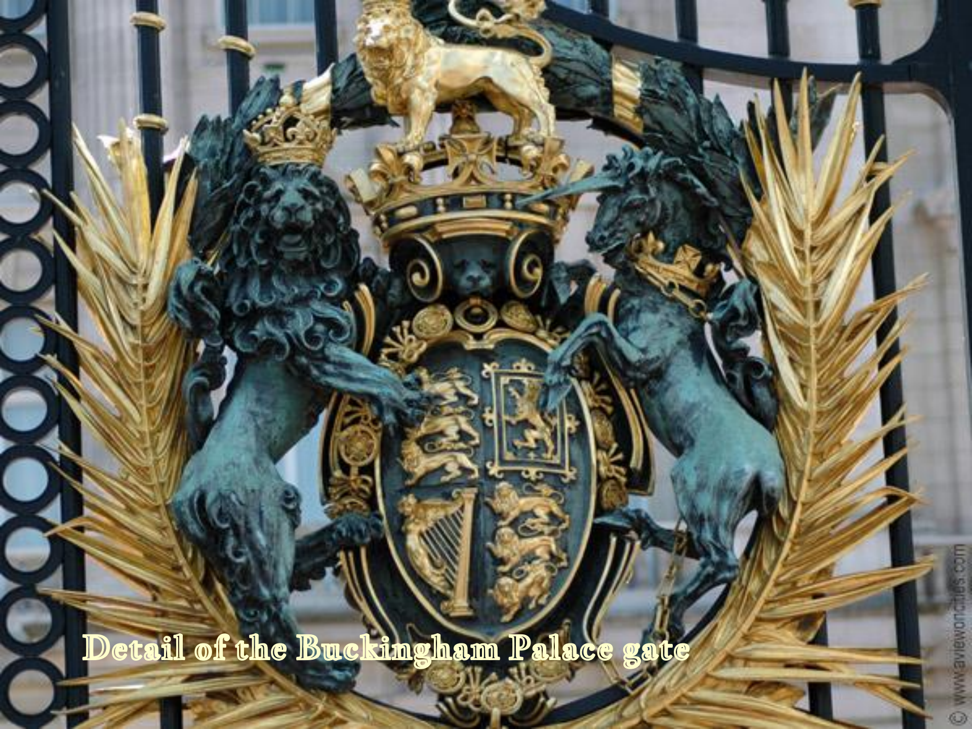
Detail of the Buckingham Palace gate