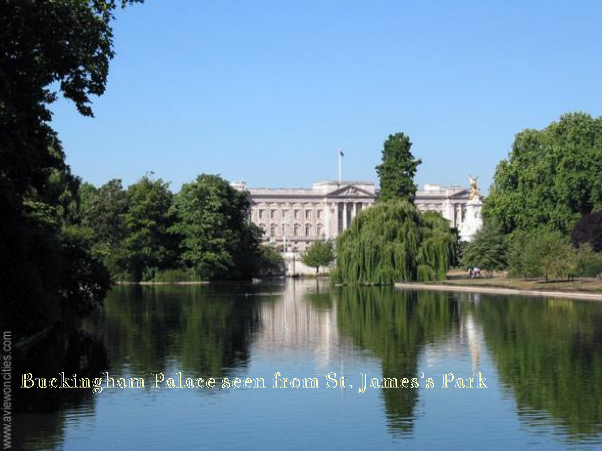
Buckingham Palace seen from St. James's Park