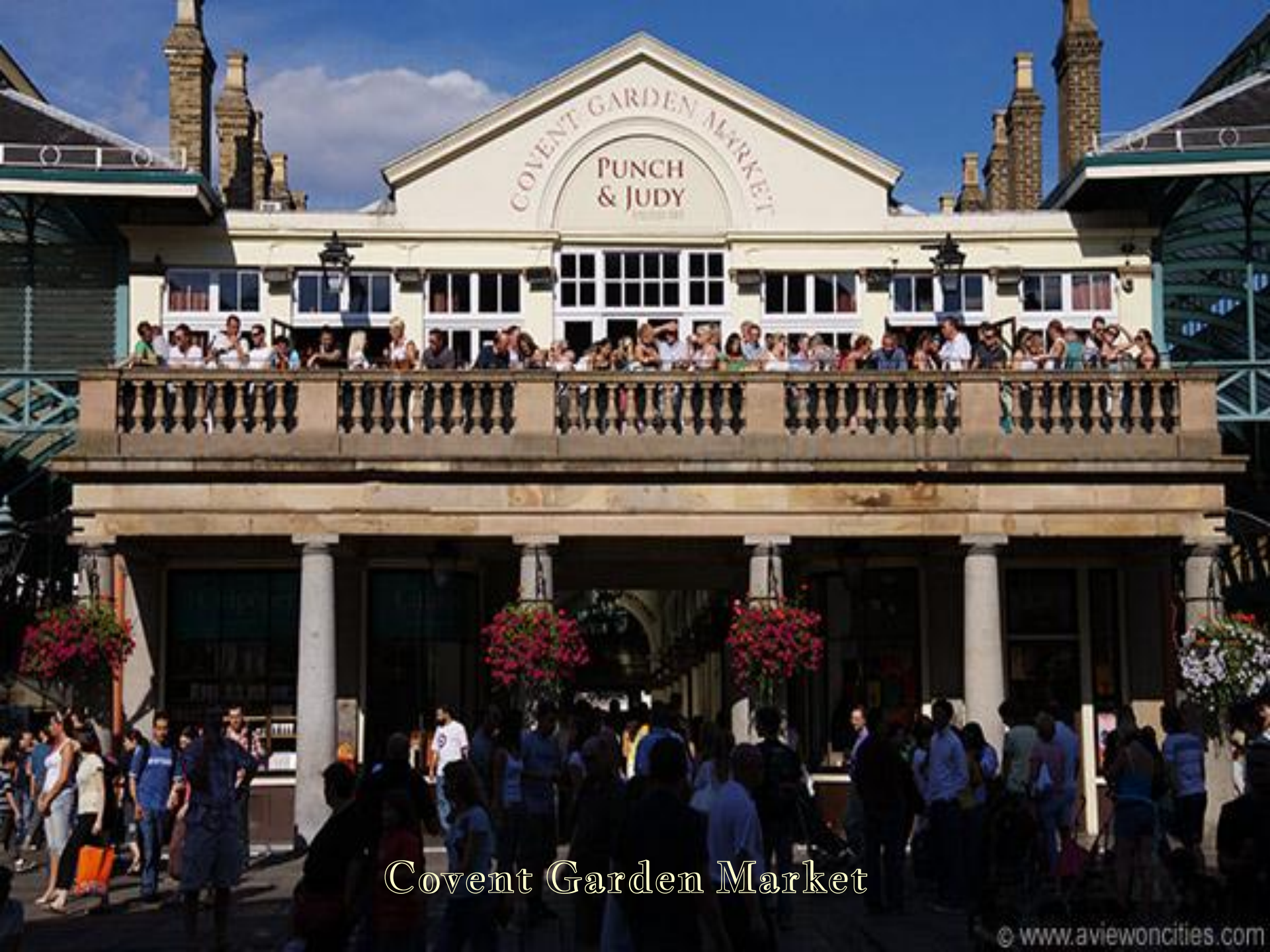
Covent Garden Market