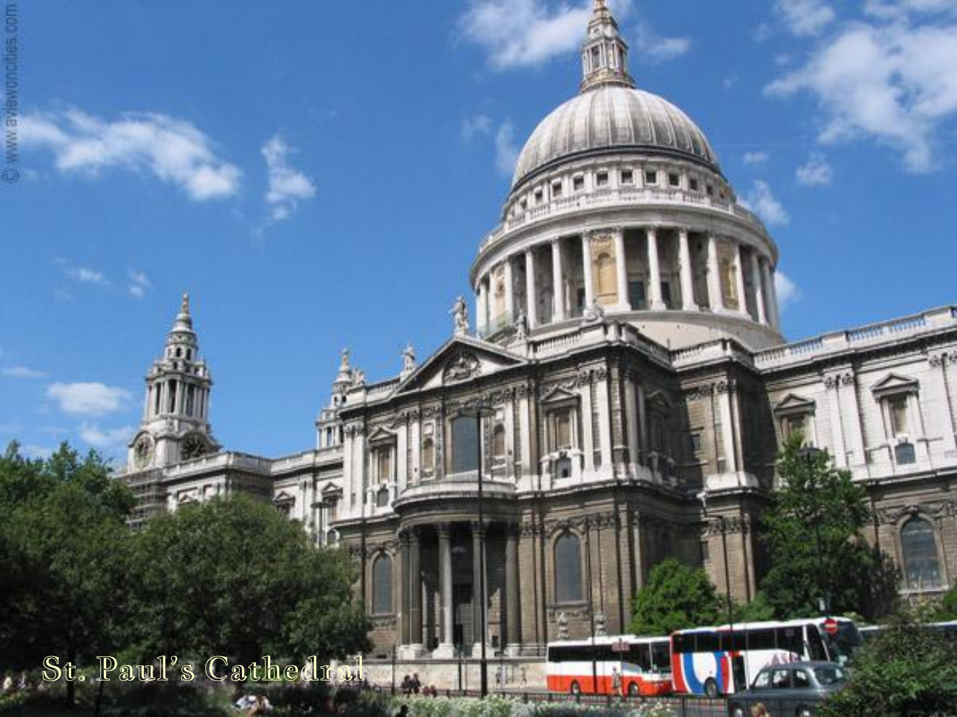
St. Paul's Cathedral