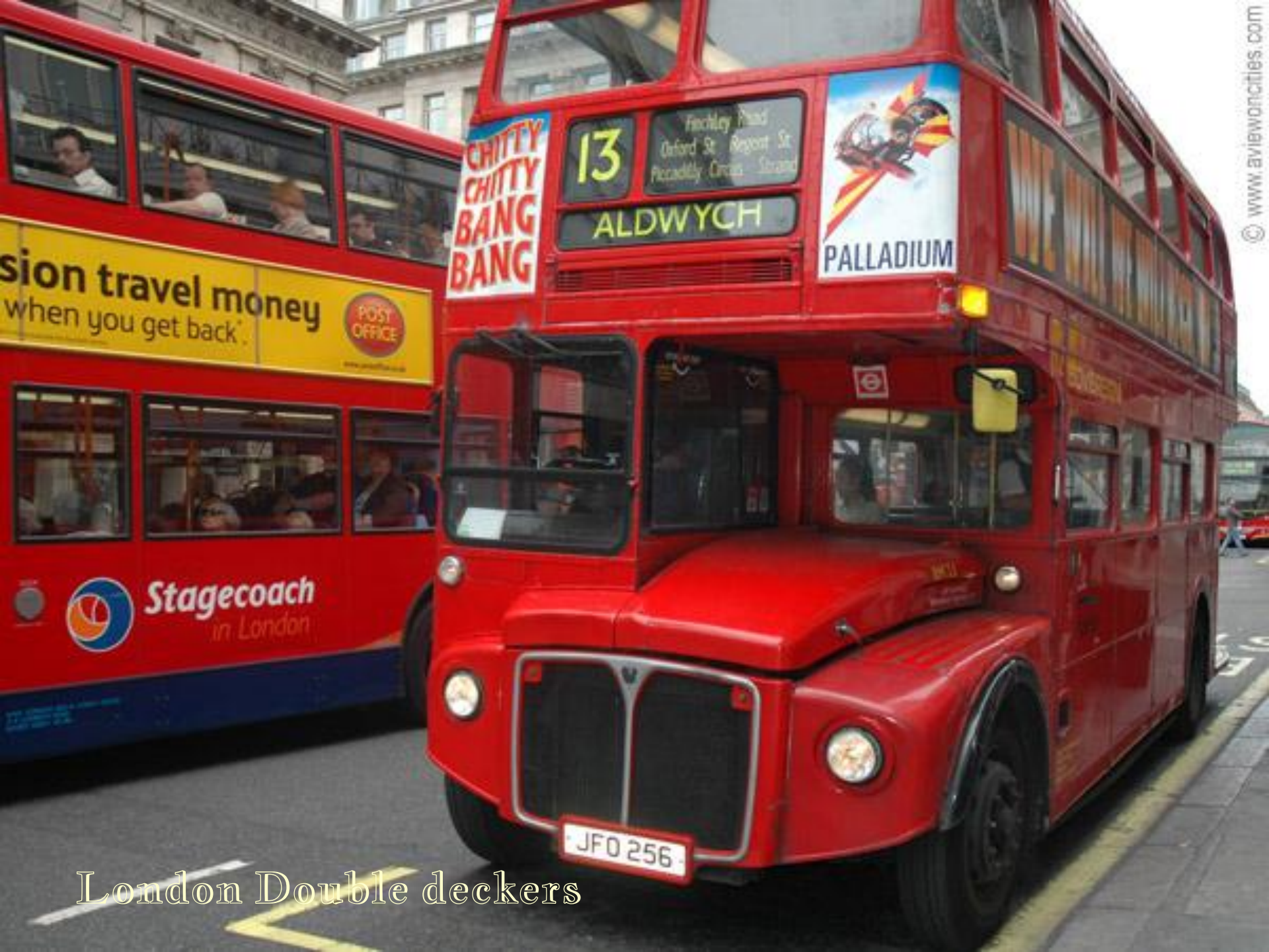
London Double deckers