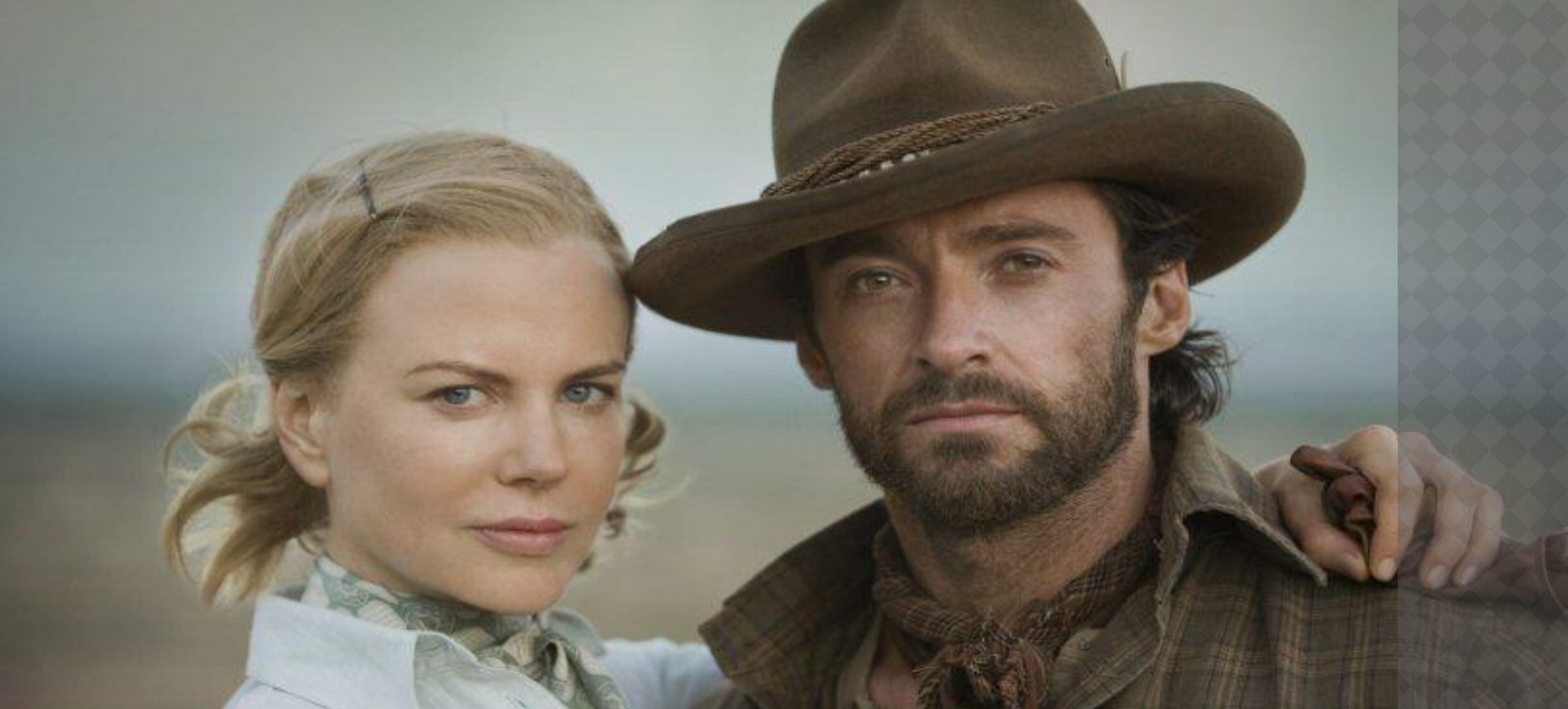
Frame from the film «Australia». Кадр из фильма «Австралия».