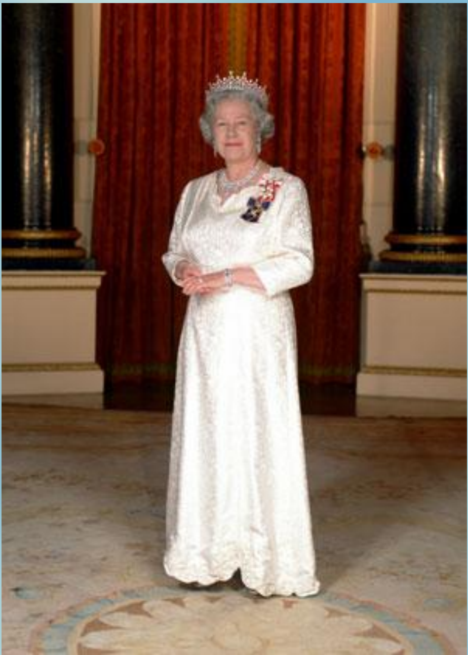
Елизавета II королева Великобрит ании