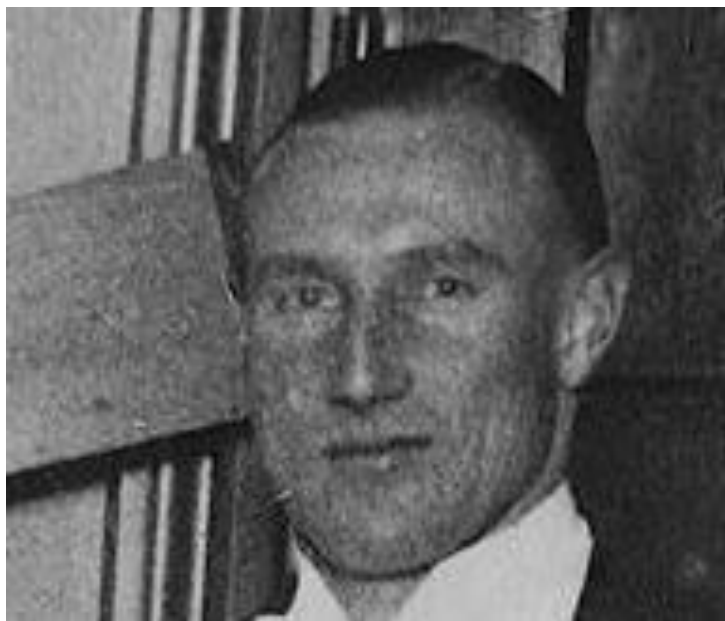
Джек Бесфорд Академическая гребля