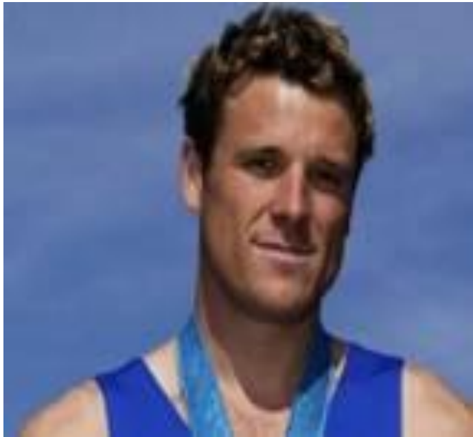
Джеймс Крекнелл Академическая гребля