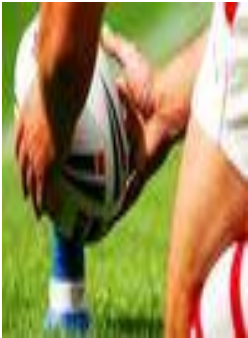
Мяч для регби