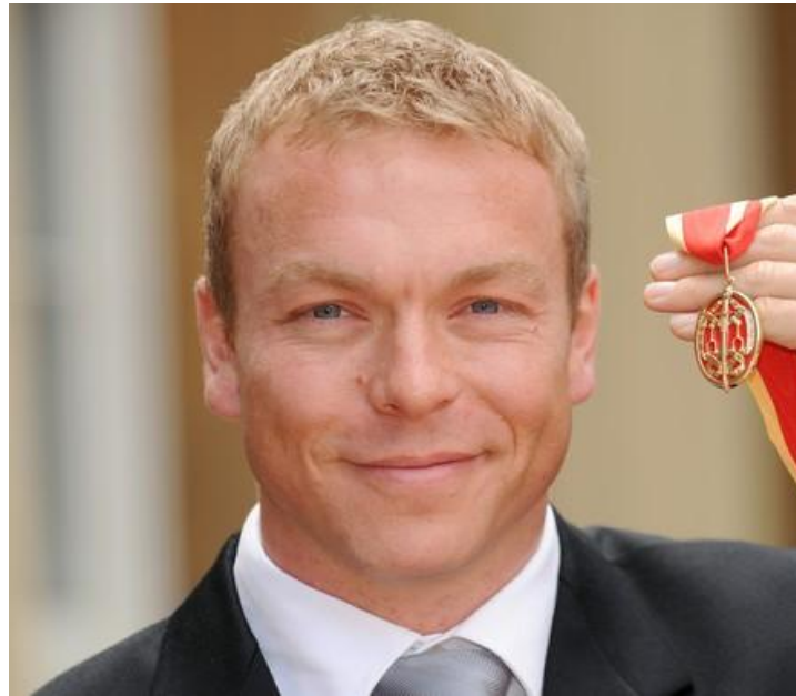
Сэр Кристофер Хой велотрек