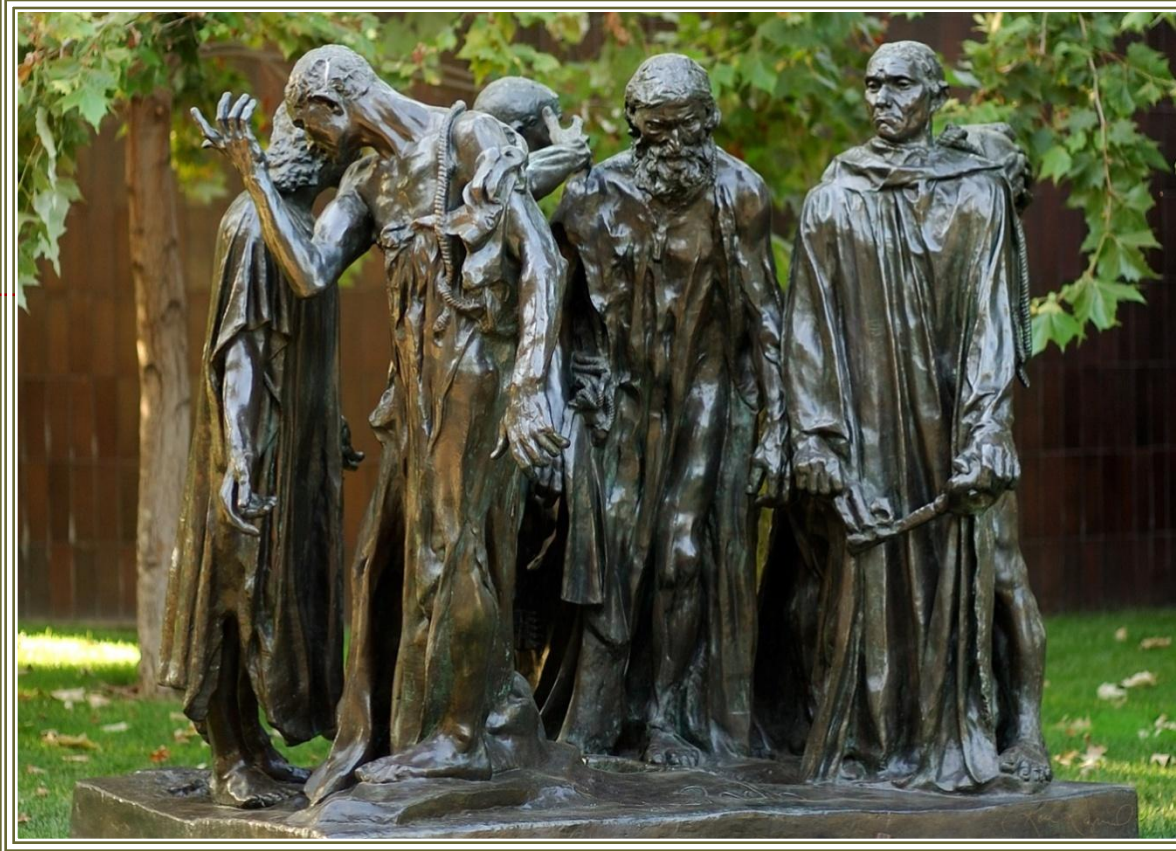
XX ст. О.Роден “Громадяни Кале”

Багатофігурна композиція французького художника – блискучий приклад жанру в скульптурі.