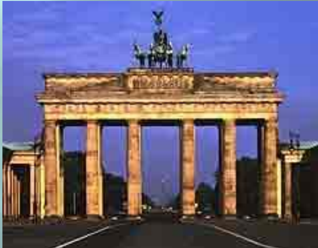
Das Brandenburger Tor