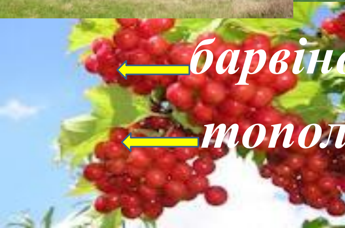
← калина →