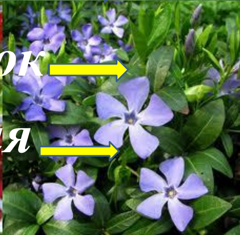
← барвінок →