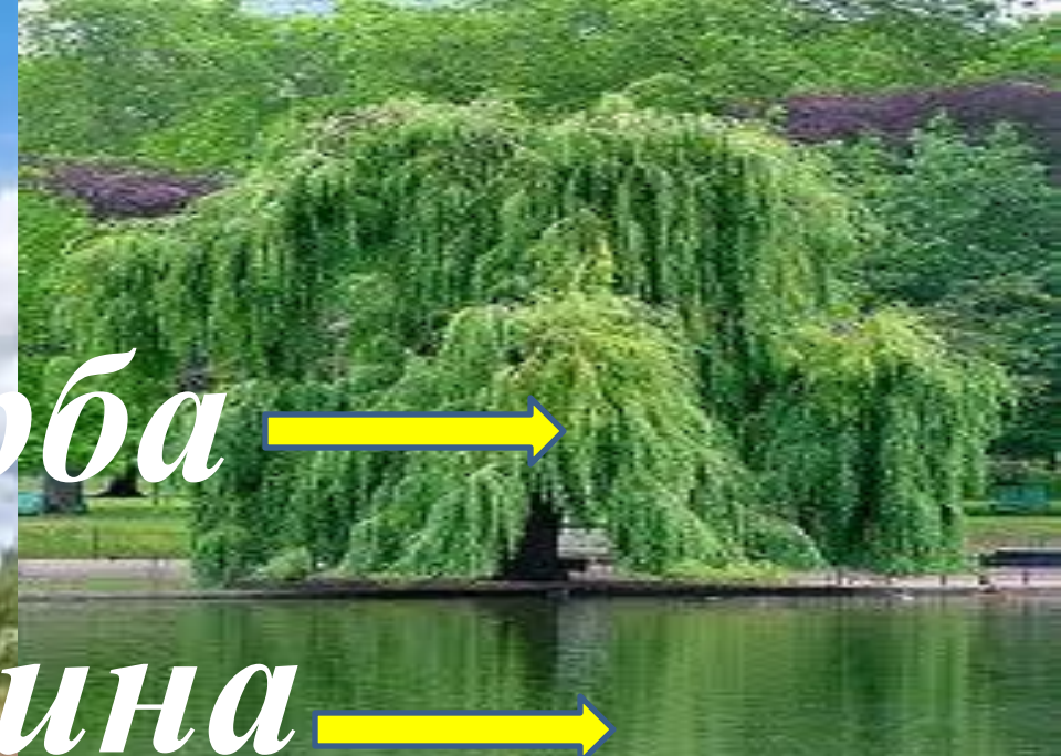
← верба →