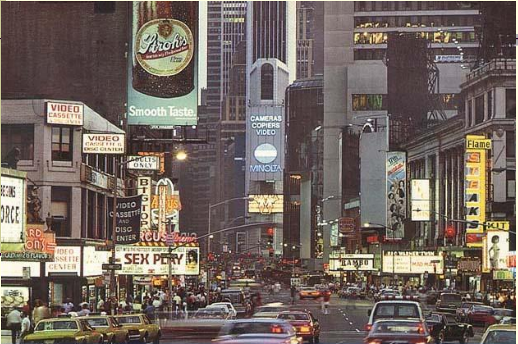
Ночной Нью-Йорк. Тайм-сквер.