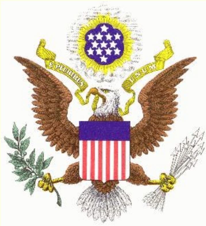
The symbol of the USA is the bold Eagle