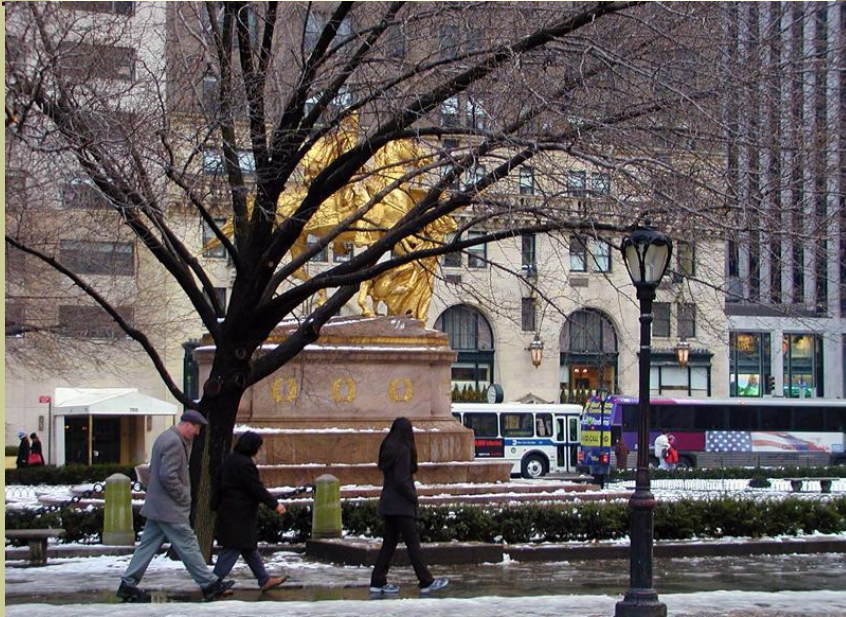
the Fifth Avenue