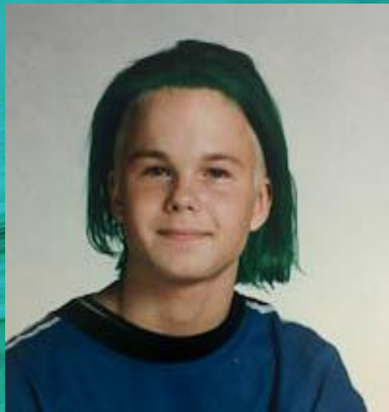
The Rasmus в 1994 году (вокалист Лаури Юльнонен)