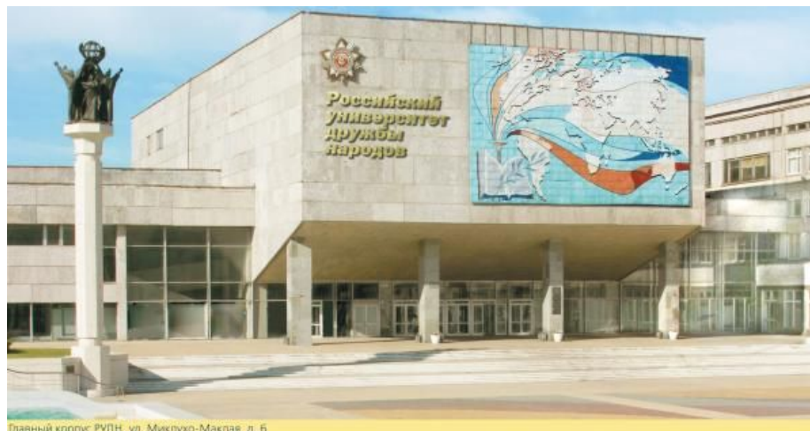
Главный корпус РУДН, ул. Миклухо-Маклая, д. 6