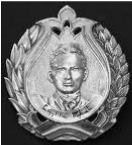
Габдулла Тукай исмендәге Татарстан Дәүләт премиясе.

Габдулла Тукай истәлегенә күп әдәби һәм мәдәни чаралар, оешмалар аның исемен йөртә. Шуларның арасында: