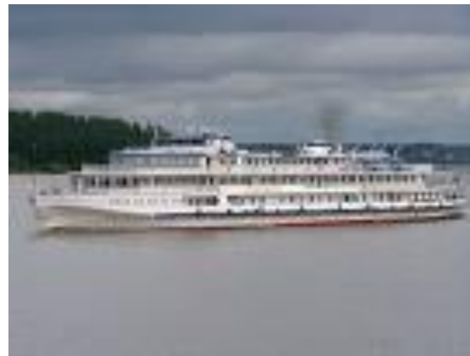
Тукай исмендәге теплоход