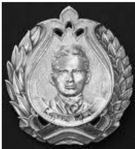
Габдулла Тукай исемендәге Татарстан Дәүләт премиясе.

Габдулла Тукай истәлегенә күп әдәби һәм мәдәни чаралар, оешмалар аның исемен йөртә. Шуларның арасында: