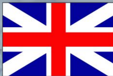
Original Union Flag (1606)