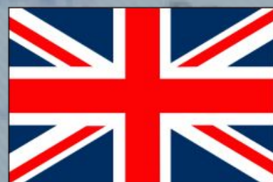
Current Union Flag (1801)

Флаг Великобритании называется «The Union Jack». Он состоит из трех крестов: крест святого Георгия, покровителя Англии, крест святого Андрея, покровителя Шотландии, и крест святого Патрика, покровителя Ирландии.