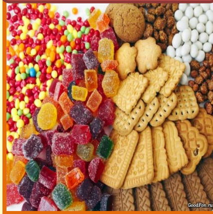
The Sweet Shop