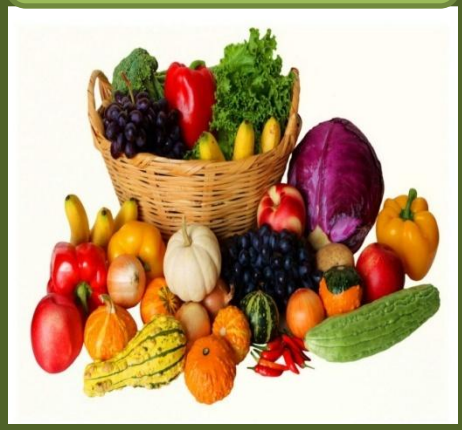
The Green Shop